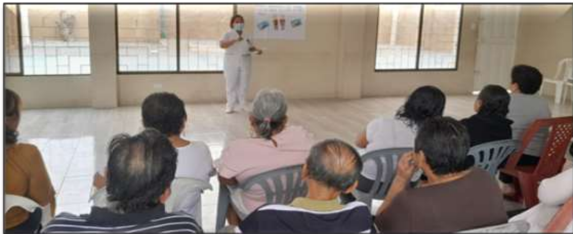
Imagen #2: Charla educativa a los adultos mayores de 65 a 70 años del Barrio 28 de mayo, La Libertad