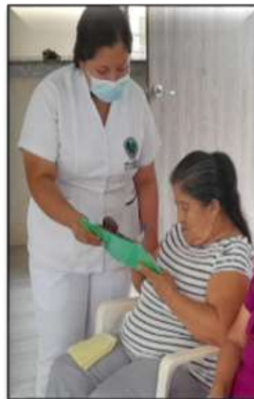
Imagen #3: Aplicación de encuesta a los participantes (adultos mayores)