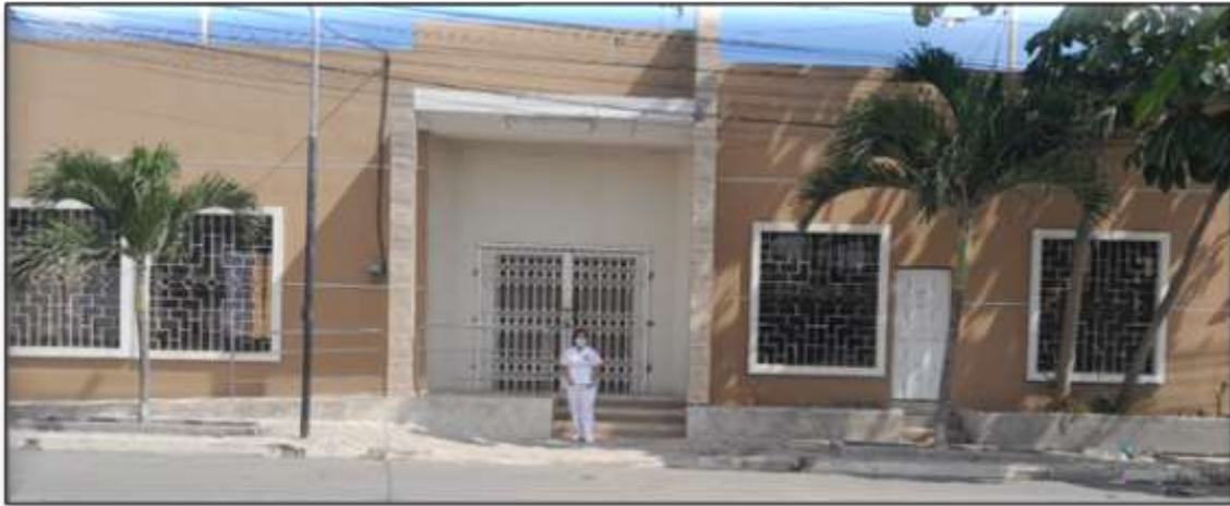
Imagen #1: Vista panorámica de la Sede Social del Barrio 28 de mayo, La Libertad.