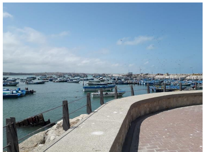
Ilustración 3 Embarcaciones del puerto pesquero de Anconcito.