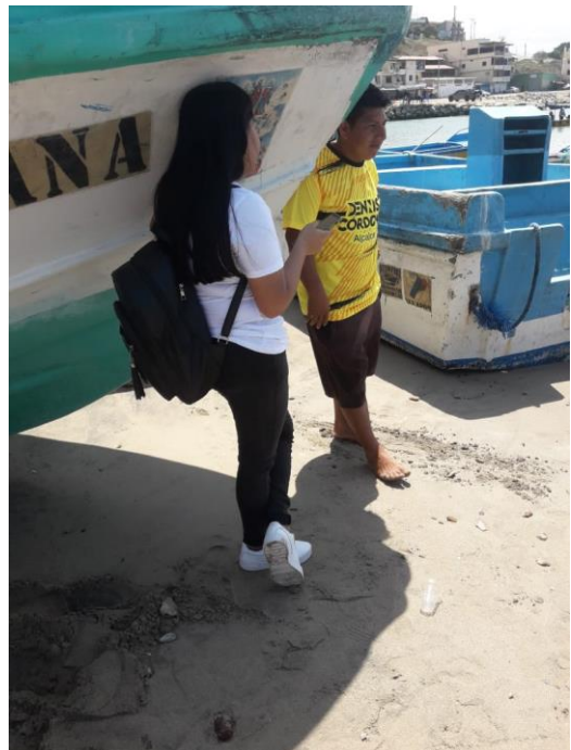
Ilustración 1 Encuesta a pescadores de la actividad pesquera.