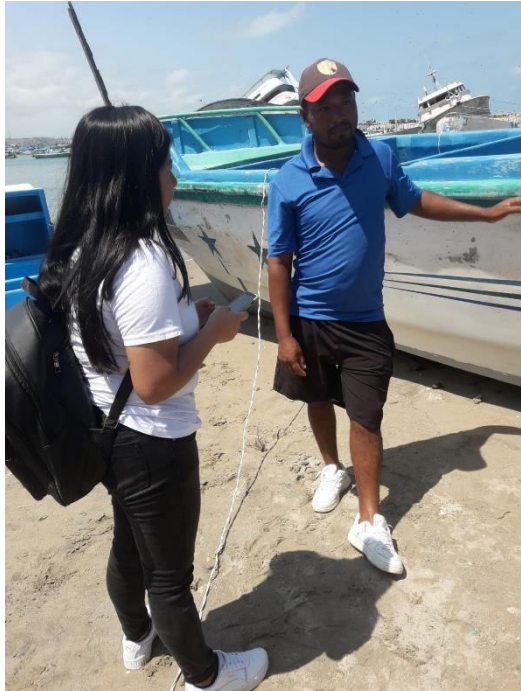
Ilustración 2 Encuesta a pescadores de Anconcito.