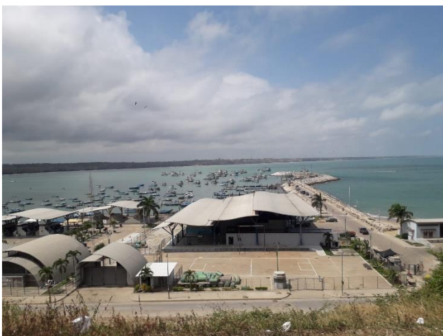
Ilustración 4 Puerto pesquero de Anconcito.