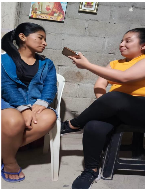
Ilustración 3 Entrevista-Familia Monoparental (1)