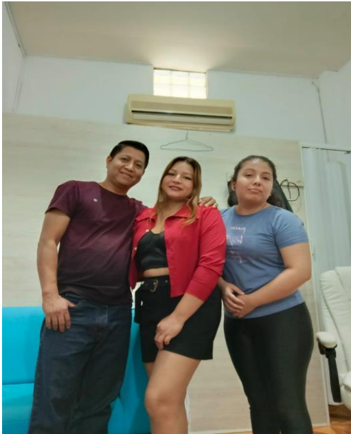
Ilustración 1 Entrevista-Familia Nuclear (2)