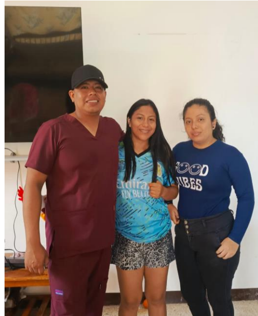
Ilustración 2 Entrevista-Familia Nuclear (3)