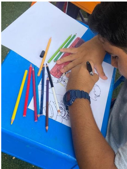
ILUSTRACIÓN 1 DIBUJO DE UN ALUMNO.