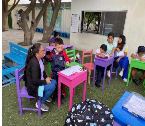
ILUSTRACIÓN 3 ESTUDIANTES DURANTE TODA LA ACTIVIDAD.