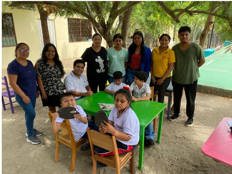
ILUSTRACIÓN 7 CULMINACIÓN DE LA ACTIVIDAD.