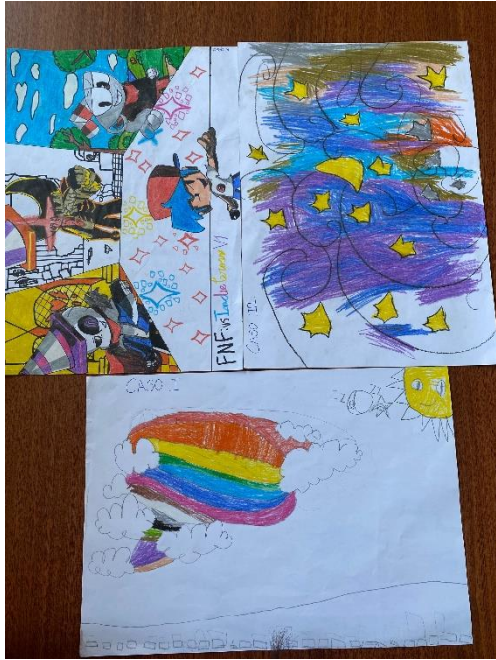
ILUSTRACIÓN 5 DIBUJOS MÁS REPRESENTATIVOS.