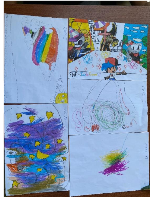
ILUSTRACIÓN 6 DIBUJOS DE TODOS LOS ALUMNOS.