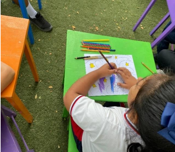
ILUSTRACIÓN 2 ALUMNA DIBUJANDO.