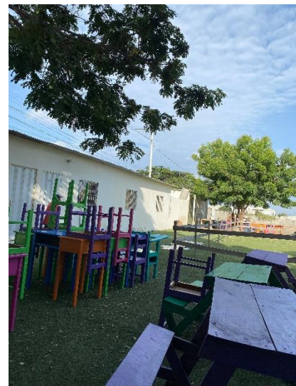
ILUSTRACIÓN 4 ESPACIO PARA LA ACTIVIDAD.