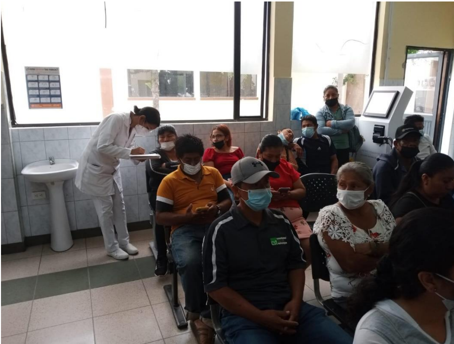
Imagen 1: Aplicación de consentimiento informado