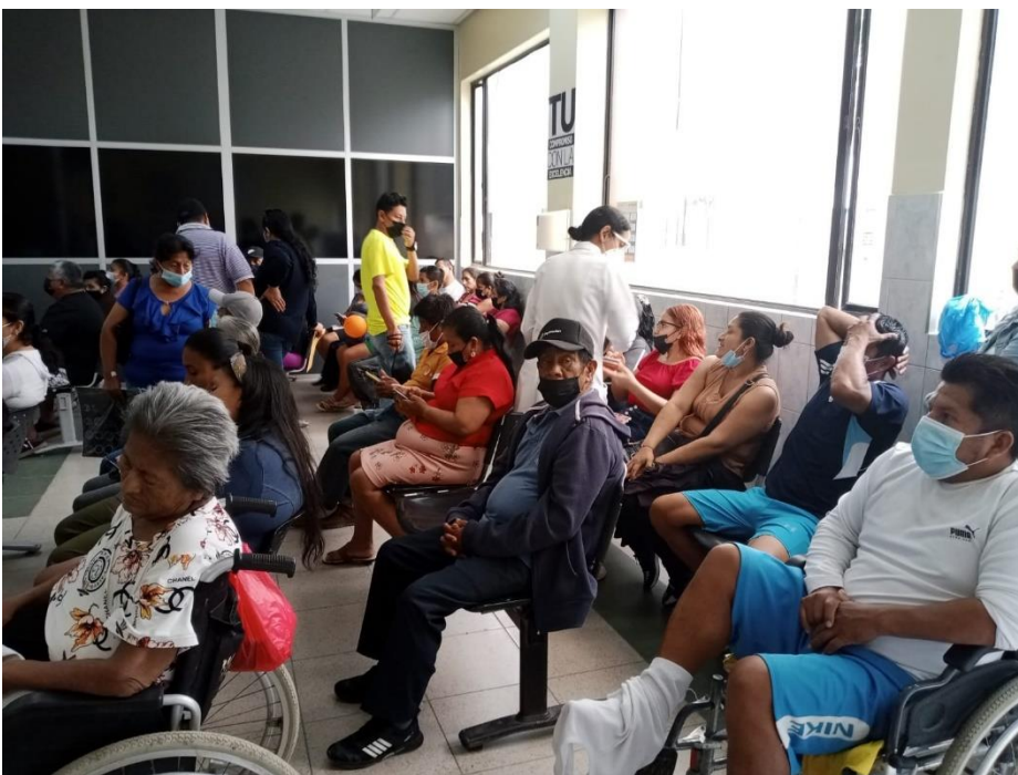
Imagen 2: Aplicación de instrumento de recolección de datos