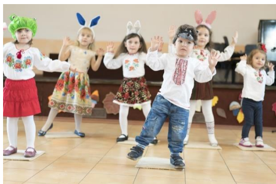
Imagen 5 Juego de seguimiento de instrucciones