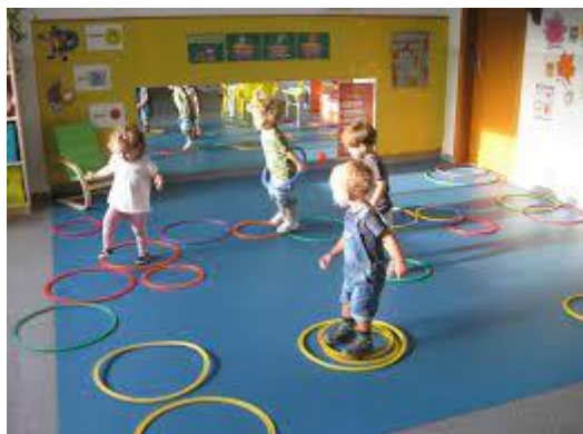
Imagen 4 Carrera de colores