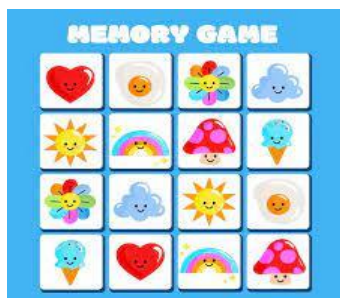
Imagen 1 Memoria de imágenes: