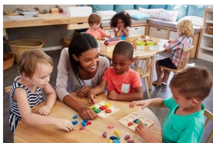
Imagen 3 Clasificación de objetos