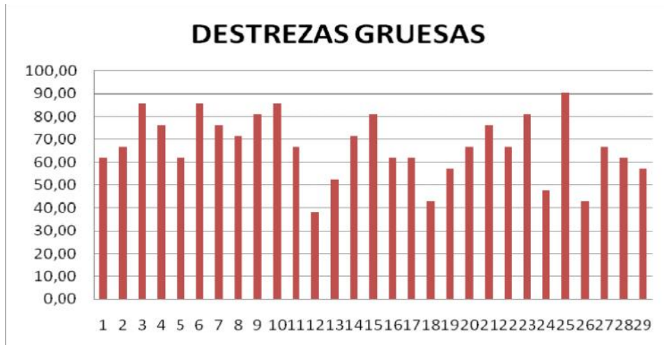
GRÁFICO N° 2 Destrezas gruesas alcanzadas

FUENTE: Fundación Santa María de la Esperanza. ELABORADO POR: Emperatriz Jacqueline Suárez Rodríguez