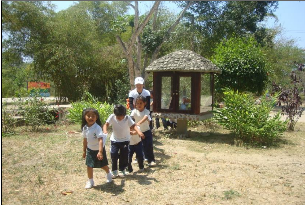
“Fila India” es lo que realizan estos niños en la Fundación Santa María de la Esperanza