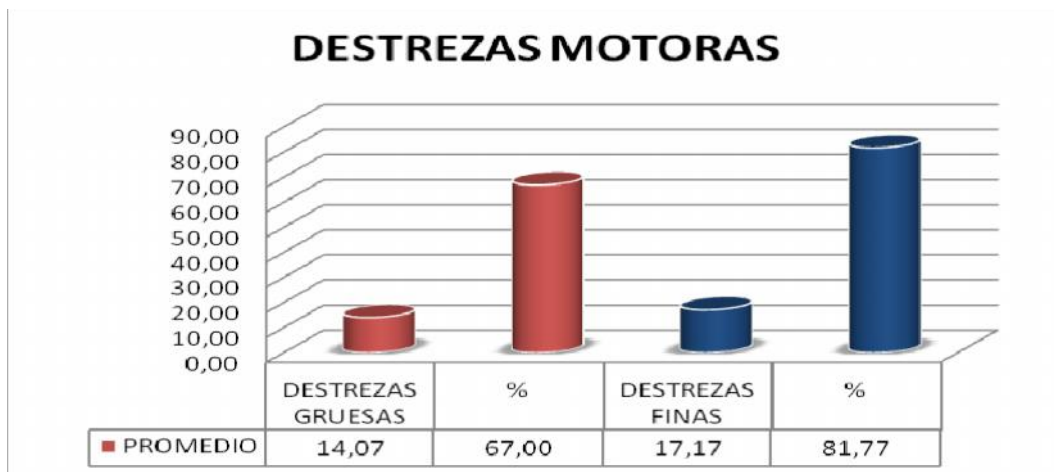
GRAFICO N° 4: Destrezas motoras alcanzadas en promedio.

FUENTE: Fundación Santa María de la Esperanza. ELABORADO POR: Emperatriz Jacqueline Suárez Rodríguez