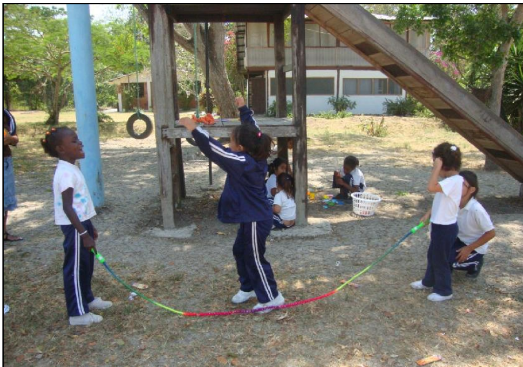
Un alto a las actividades lúdicas, los niños se distraen con juegos alternativos que existen en la Fundación