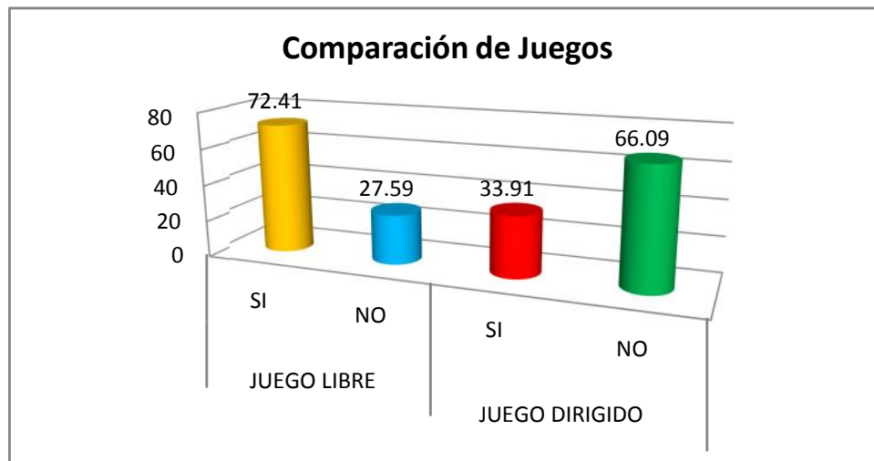
GRÁFICO N° 1