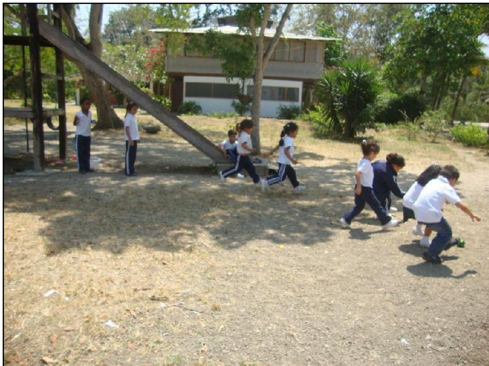
Los niños se divierten en los amplios patios que posee la Fundación