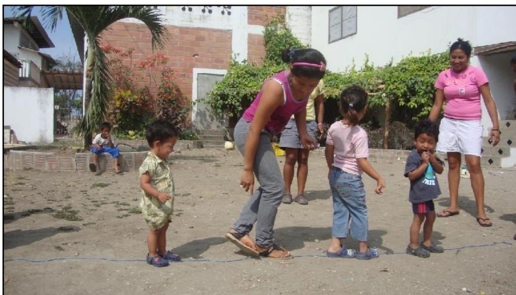
Las madres de familia, también se involucraron en las actividades lúdicas de la institución, aquí vemos a una de ellas manteniendo el equilibrio.