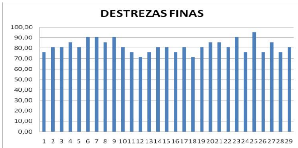
GRAFICO N° 3: Destrezas finas alcanzadas

FUENTE: Fundación Santa María de la Esperanza. ELABORADO POR: Emperatriz Jacqueline Suárez Rodríguez