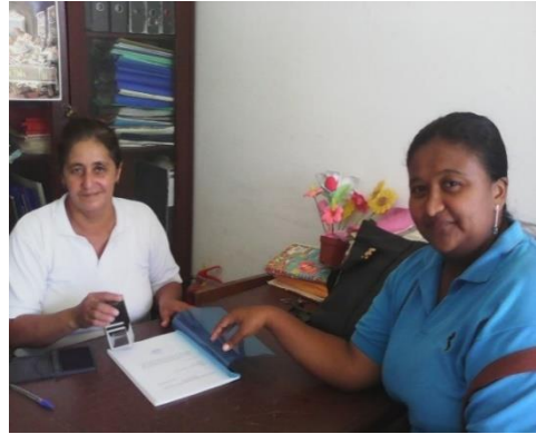
Entrevista con la directora encargada de la institución para el respectivo levantamiento de información.