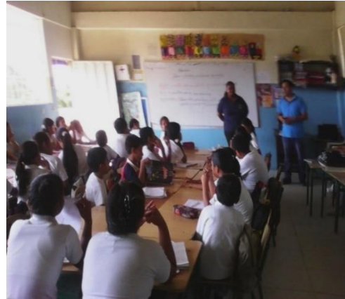
El docente de séptimo año básico firmando la entrevista realizada y la ficha de observación de su clase