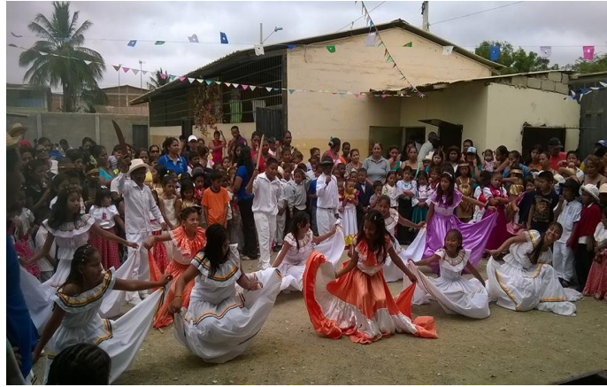
Aplicación de la actividad la danza como enfoque cultural