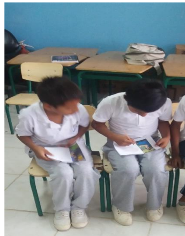
Aplicación de la actividad observamos o solo miramos