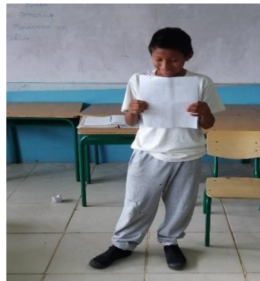
Aplicación de la propuesta “actividades”