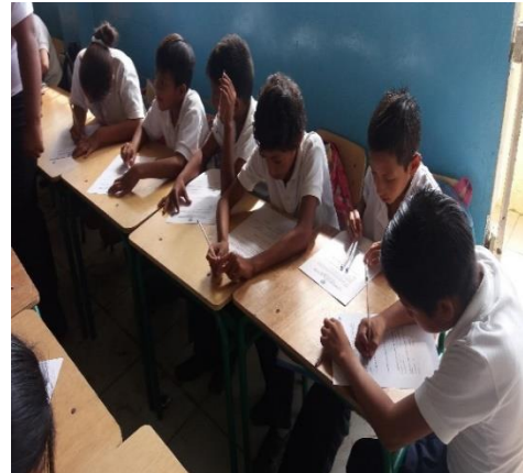
La aplicación de la encuesta a los estudiantes