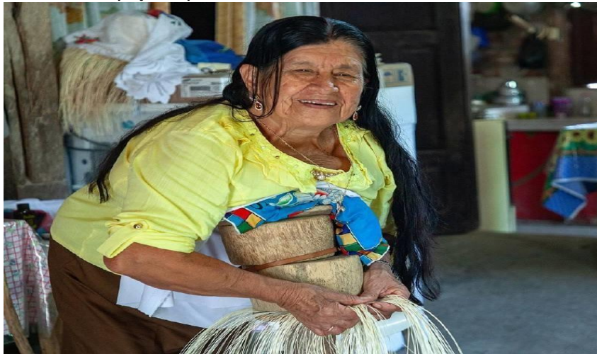
Tejedora de sombreros de paja toquilla

Nota. https://www.culturaypatrimonio.gob.ec/