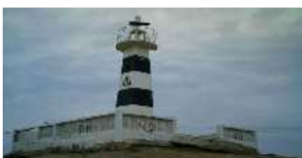
Figura 9 Faro De Anconcito