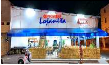
Figura 16 Establecimiento La Lojanita