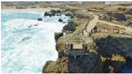
Figura 21 REMACOPSE