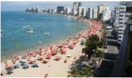
Figura 1 Balneario De Salinas