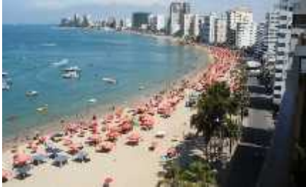
Figura 12 Balneario De Salinas