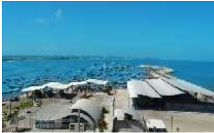
Figura 25 Puerto Pesquero De Anconcito