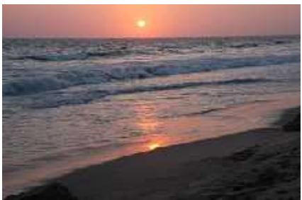
Figura 23 Playa De Punta Carnero