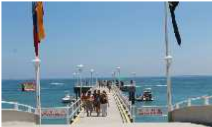
Figura 14 Muelle De Salinas