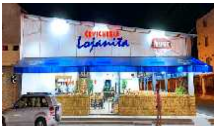
Figura 3 Establecimiento Gastronómico