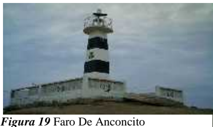
Figura 19 Faro De Anconcito