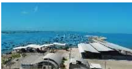
Figura 10 Puerto Pesquero De Anconcito