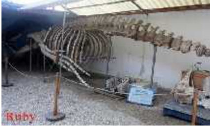
Figura 20 Museo De Las Ballenas