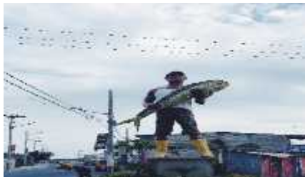
Figura 17 Pesca Artesanal En Santa Rosa