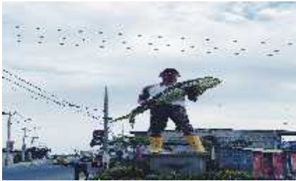
Figura 22 Pesca Artesanal En Santa Rosa