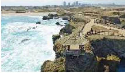
Figura 4 REMACOPSE

• Nos desplazamos hacia La Reserva Marino Costera Puntilla de Santa Elena (Remacopse) es un punto fijo que se debe visitar en este balneario peninsular, estará brindada la información un Guía especializado local y compras de artesanías.