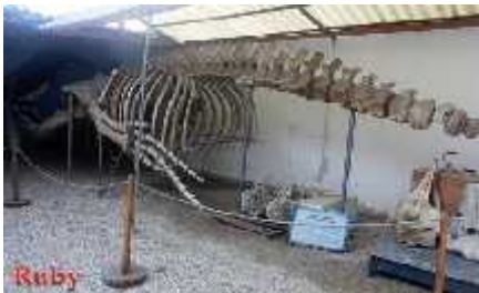
Figura 13 Museo De Las Ballenas