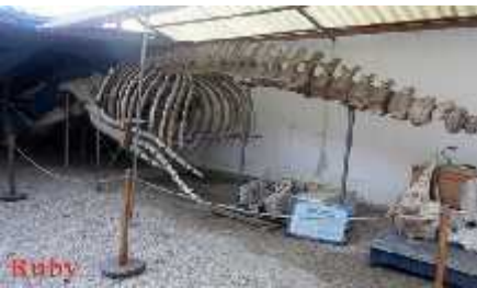
Figura 6 Museo De Las Ballenas

• Luego del desayuno tradicional, arribo al museo de las ballenas, es una colección privada de especímenes de mamíferos marinos que se encuentra abierta al público desde junio de 2004 en la ciudad de Salinas.