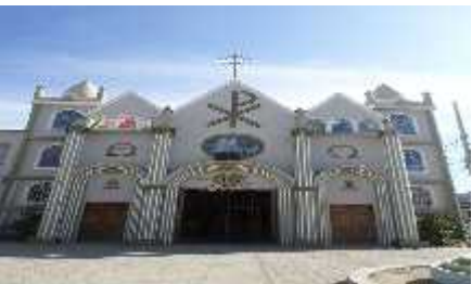
Figura 7 Iglesia San Rafael

• Luego del desayuno tradicional, arribo al museo de las ballenas, es una colección privada de especímenes de mamíferos marinos que se encuentra abierta al público desde junio de 2004 en la ciudad de Salinas.