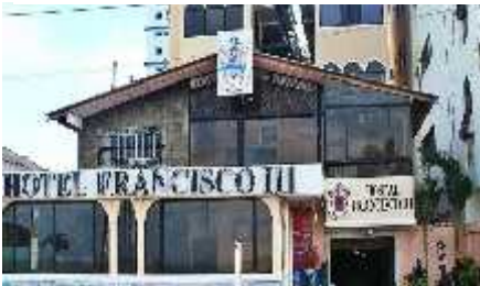
Figura 5 Establecimiento Hotelero

• Nos desplazamos hacia La Reserva Marino Costera Puntilla de Santa Elena (Remacopse) es un punto fijo que se debe visitar en este balneario peninsular, estará brindada la información un Guía especializado local y compras de artesanías.