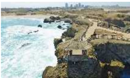
Figura 15 REMACOPSE