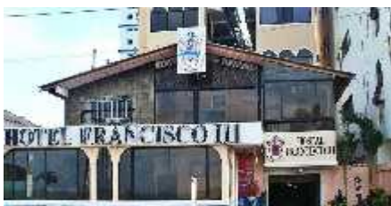
Figura 11 Hotel San Francisco