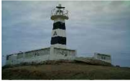
Figura 24 Faro De Anconcito