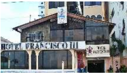
Figura 2 Alojamiento Para El Grupo