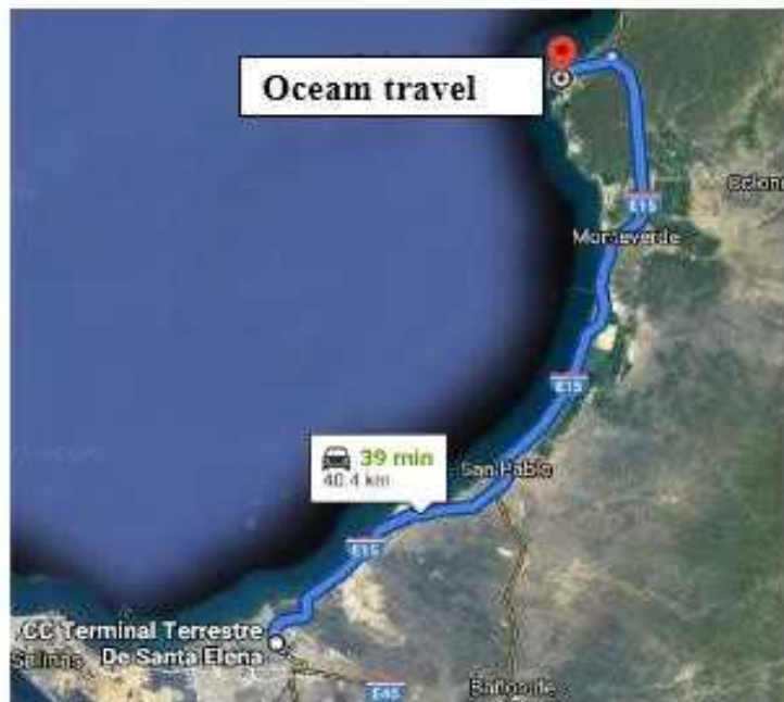
Figura 4 Ruta de la operadora Ocean Travel