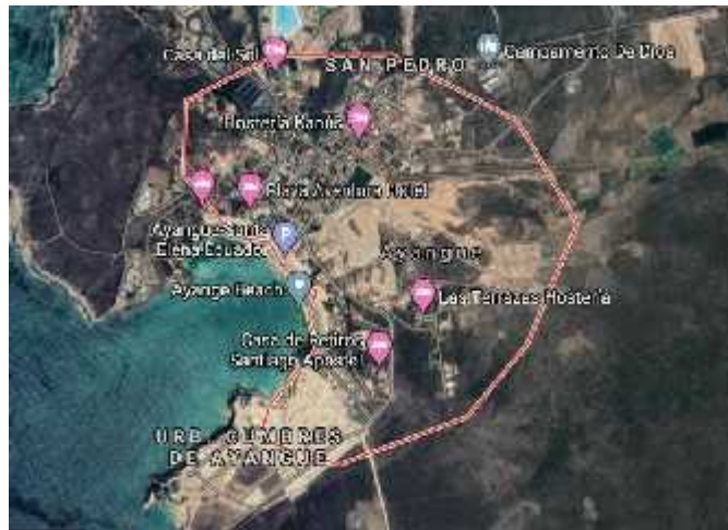
Figura 2 Ubicación Comuna Ayangue

El negocio estará situado en la comuna Ayangue de la parroquia Colonche, perteneciente a la provincia de Santa Elena, ya que se puede practicar buceo, snorkeling, y algunos deportes acuáticos que incentivan la visita de turistas nacionales y extranjeros en temporadas altas y en feriados nacionales.