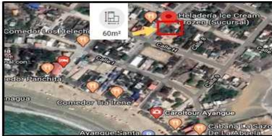
Figura 3 Ubicación de la oficina de la operadora Ocean Travel