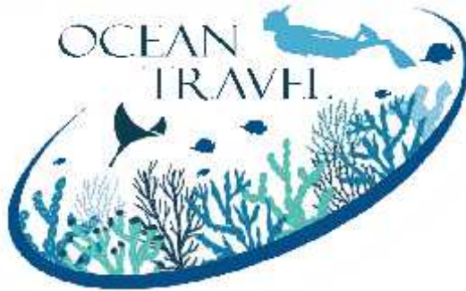
Figura 1 Logotipo de la empresa