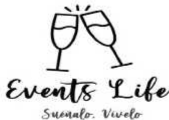
Figura 1 Logo de la empresa