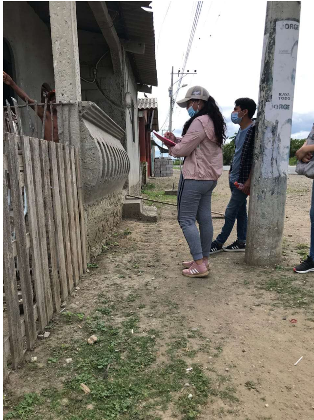
Figura 7A. Encuesta en la comuna Janbelí