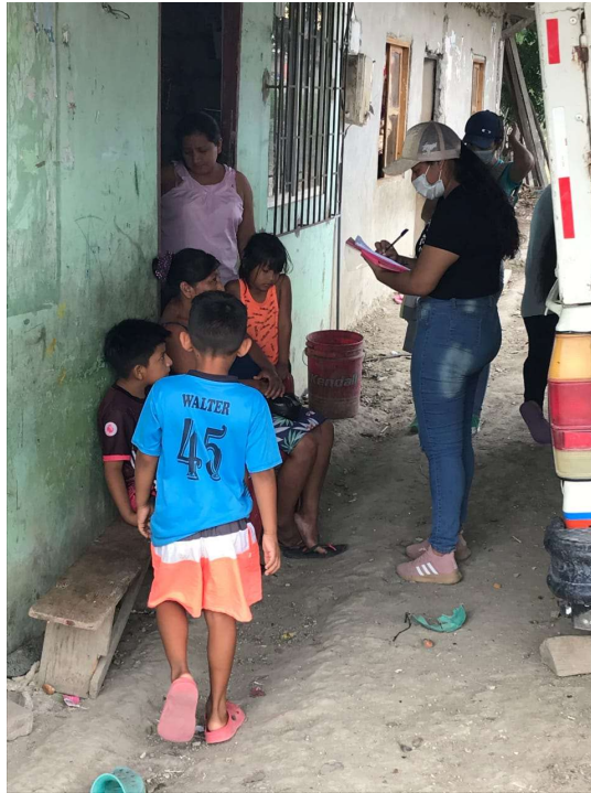
Figura 5A Encuesta en la comuna Bajadita de Colonche.