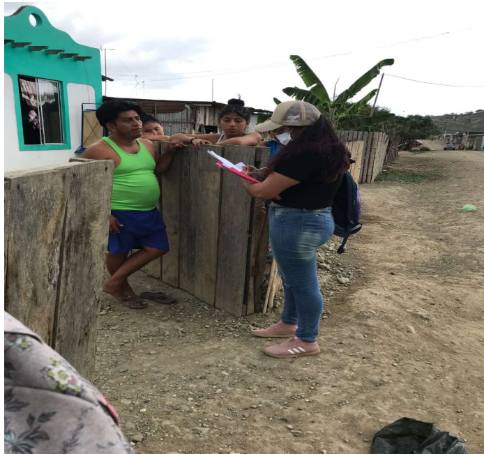
Figura 2A. Encuesta en la comuna Bambil Desecho