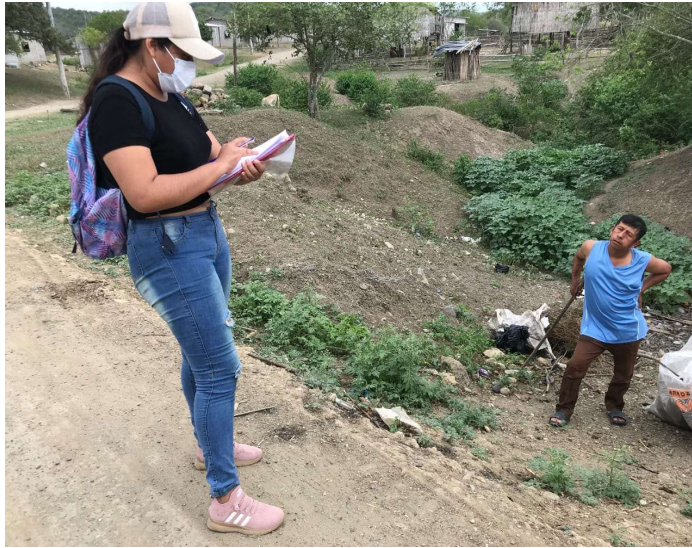
Figura 1A. Toma de encuesta en la comuna