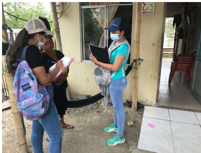
Figura 4A. Encuesta en la comuna Manantial de Guangala