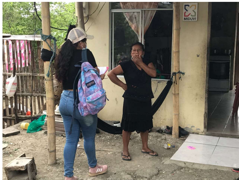
Figura 8A. Encuestas en la comuna Las Balsas