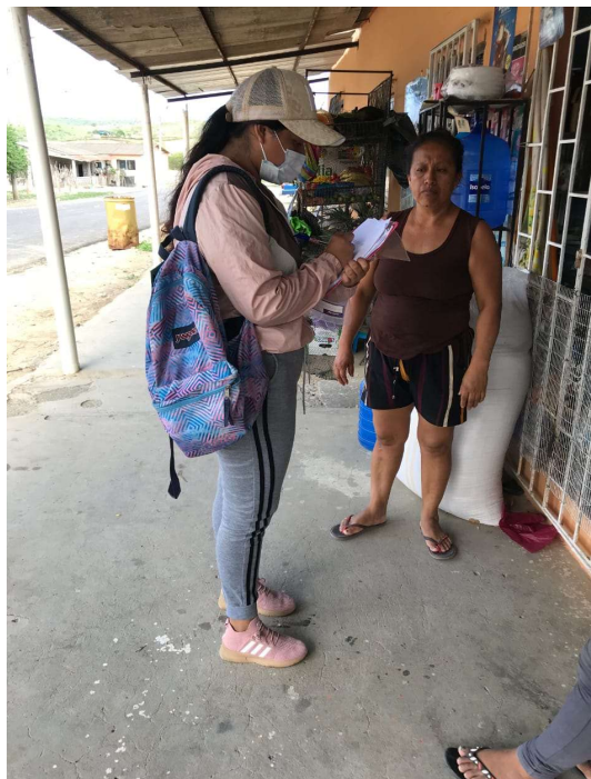
Figura 6A. Encuesta en la comuna Aguadita