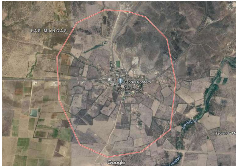
Figura 1. Mapa geográfico de la parroquia Colonche.