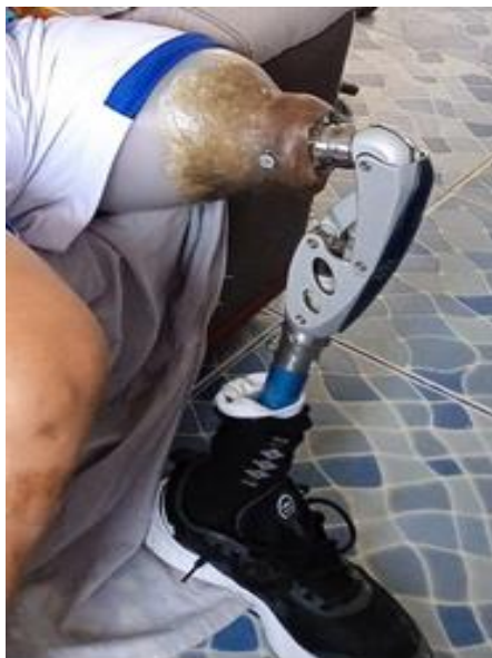
Anexo 4. Prótesis