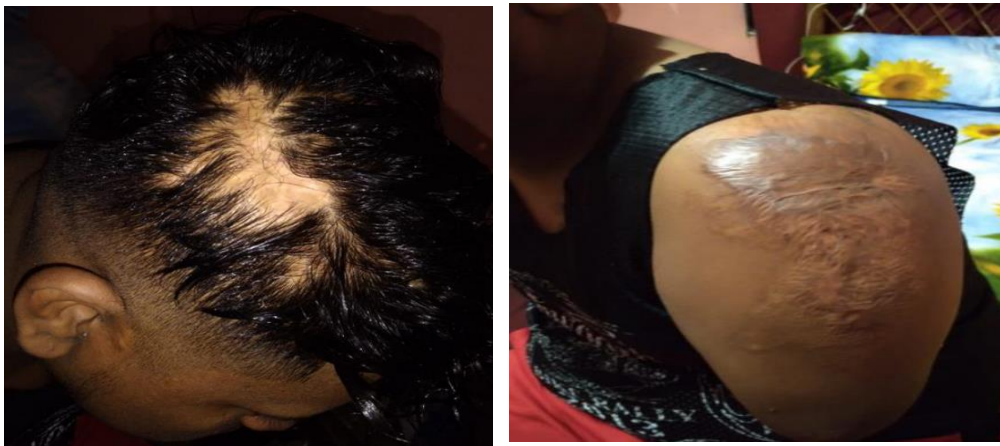
Anexo 2. Secuelas de descarga eléctrica