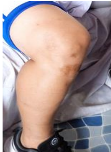
Anexo 5. Secuela descarga eléctrica