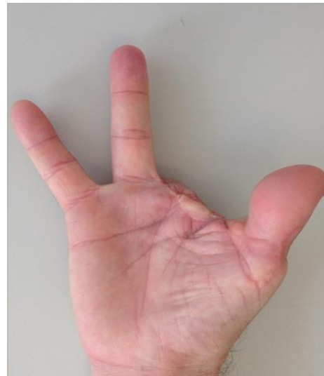
Anexo 7. Amputación de dedos