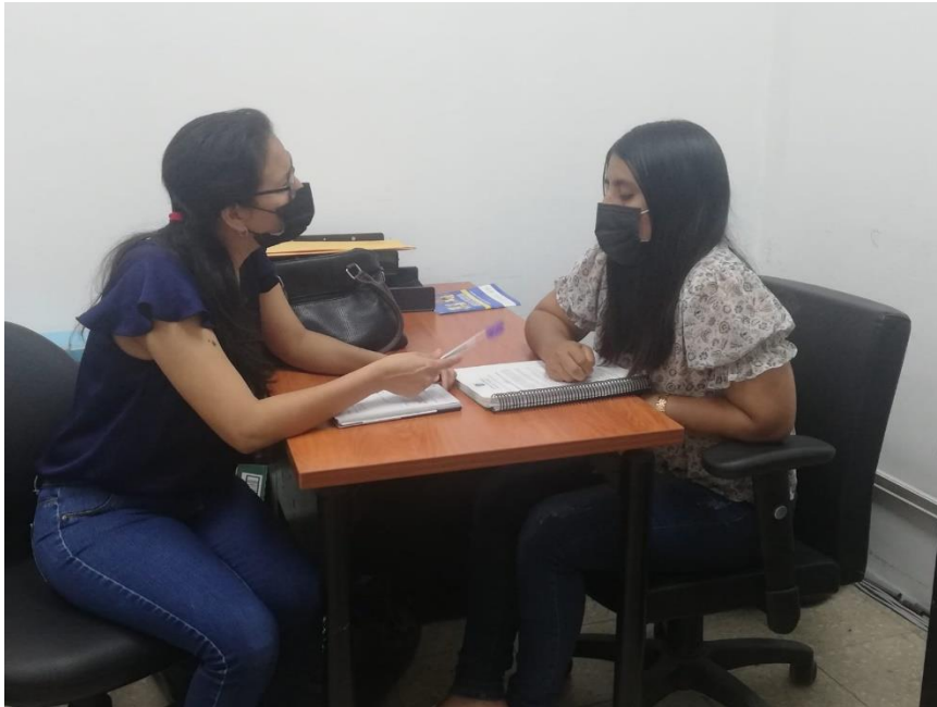
Nota: Aplicando la entrevista a una funcionaría del GAD Provincial de Santa Elena