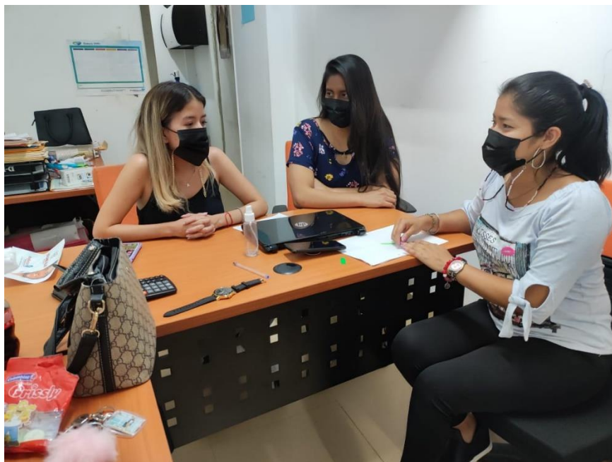
Nota: Aplicando entrevista a una funcionaria del GAD Provincial de Santa Elena