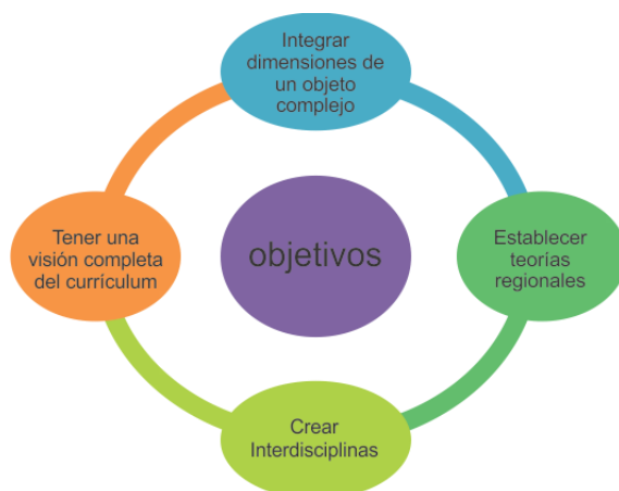
Figura 1.- Teoría Curricular.

La forma que tiene de comprender el mundo que le rodea, está muy alejada de la lógica del pensamiento adulto, sin embargo, la acción, la sensorialidad, la creatividad, la metáfora, el símbolo o la investigación son para la primera infancia la manera natural de desarrollar el aprendizaje.