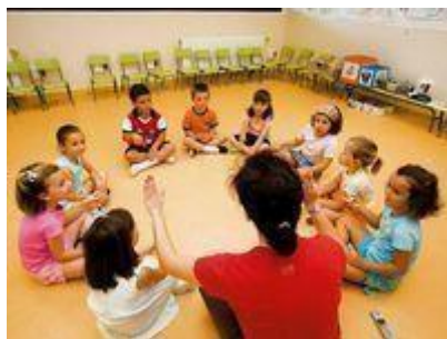
Ilustración 1 Ronda previo a la lectura del cuento

Nota: El cuento como estrategia psicopedagógica para favorecer la integración y despertar la imaginación en los niños. (Cruz, s.f.)