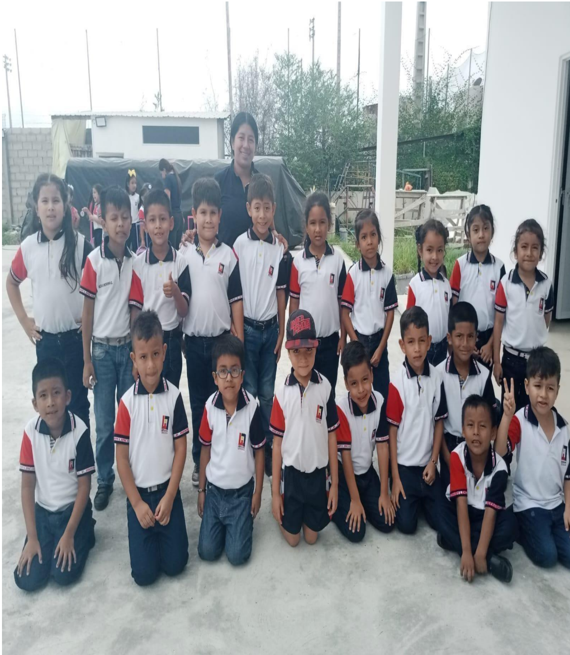
Ilustración 2 Niños reunidos previo a la explicación de la estrategia a realizar