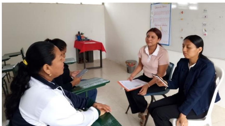
Recopilación de datos de la entrevista.