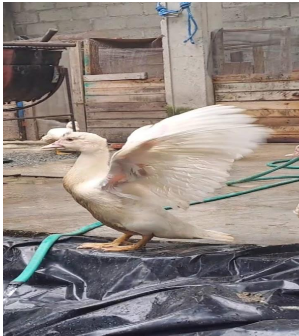
Figura 10A. Recreación semana 6