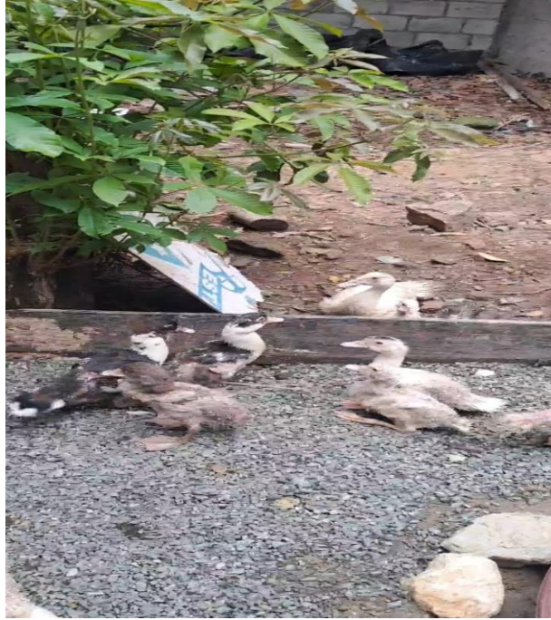
Figura 7A. Recreación al aire libre