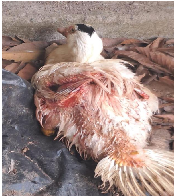
Figura 8A. Lesiones por picoteo