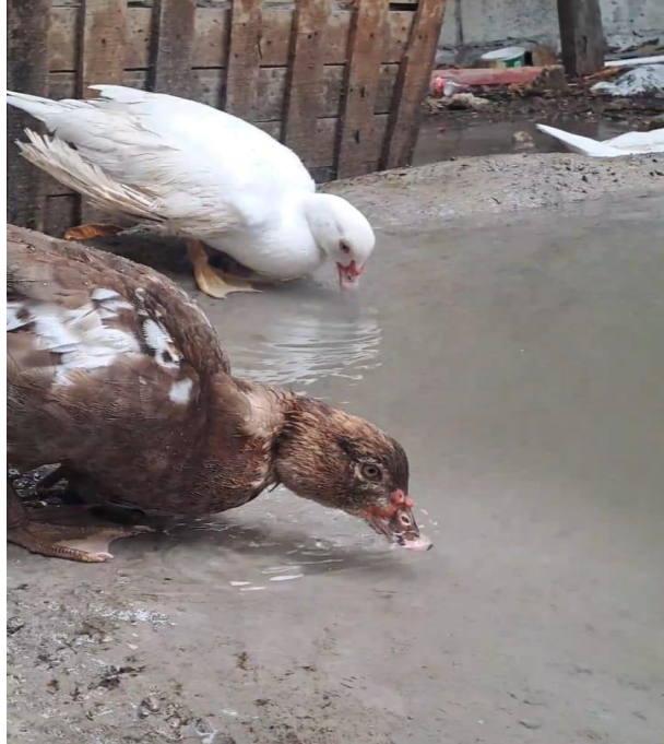
Figura 15A. Recreación en piscina