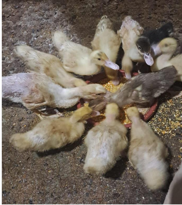
Figura 3A. Aceptación del alimento