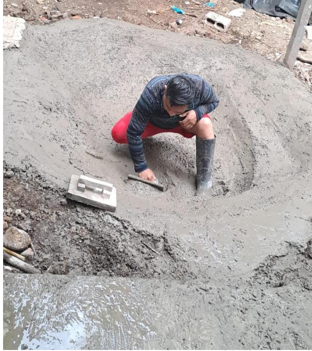
Figura 11A. Implementación de piscina para recreación