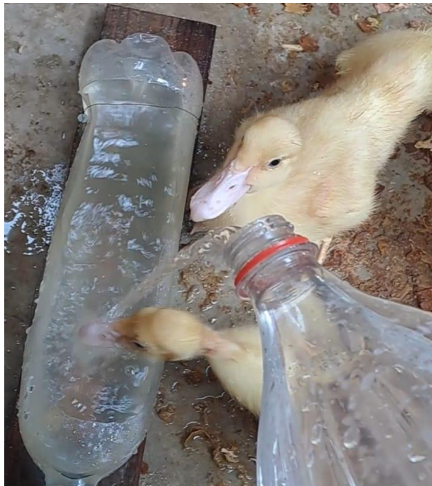
Figura 6A. Hidratación de los patos