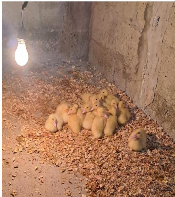
Figura 2A. Adaptabilidad del espacio