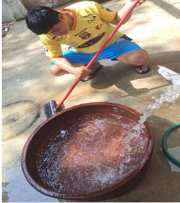
Figura 5A. Limpieza y desinfección del área