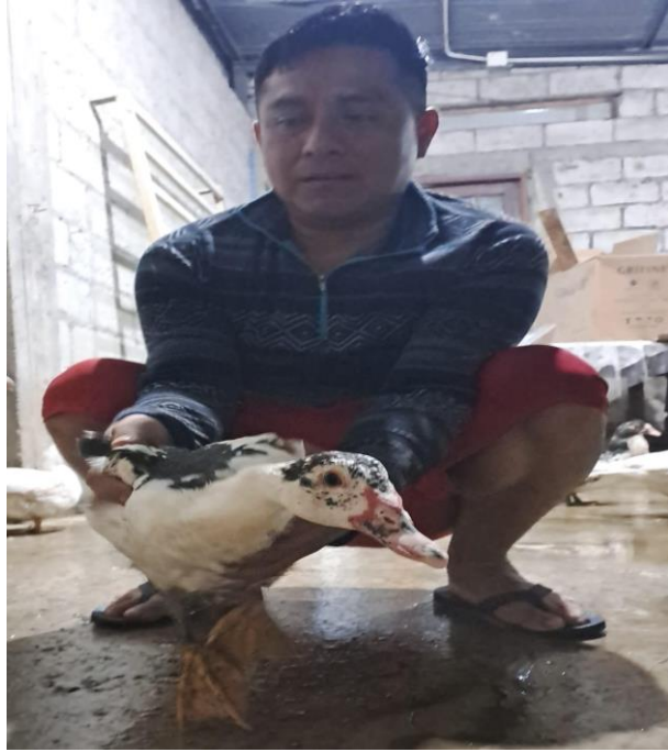
Figura 9A. Manipulación y revisión