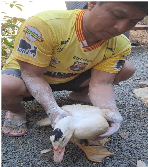
Figura 16A. Manipulación por control