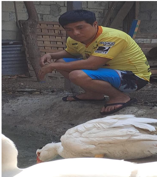
Figura 12A. Monitoreo a los animales