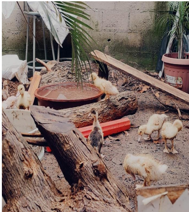
Figura 4A. Recreación T1