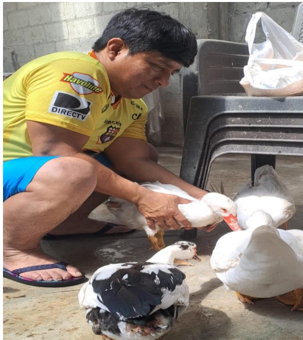
Figura 14A. Control del pato por agresividad