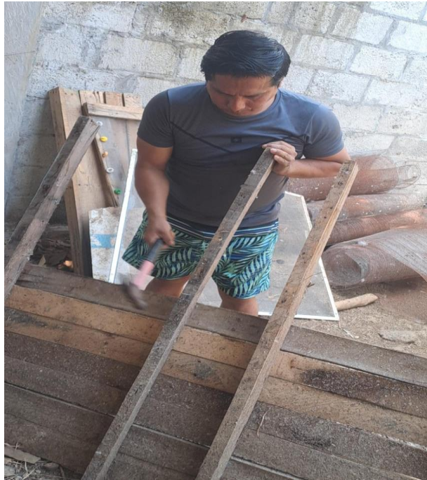
Figura 1A. Construcción del galpón