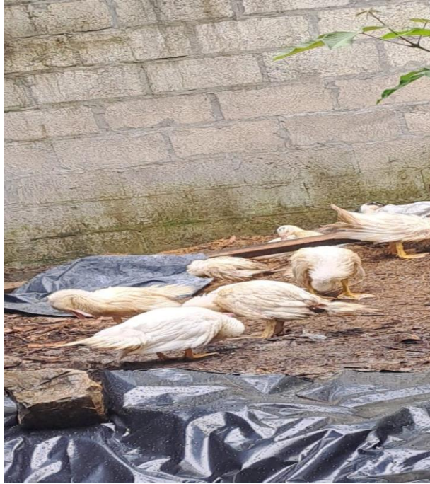
Figura 13A. Secado natural del plumaje