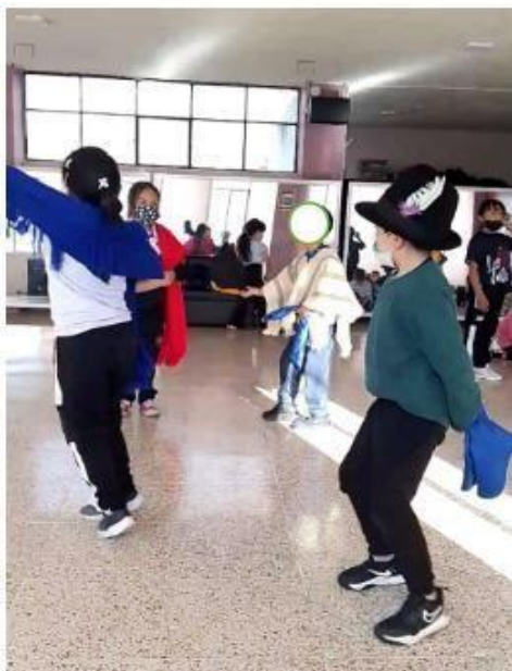
Anexo 1. Registro fotográfico de la intervención pedagógica.