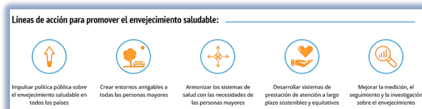
Figura 3.1: Líneas de acción para promover el envejecimiento saludable (Organización Panamericana de la salud)

en que las personas piensan, sienten y actúan hacia la edad y el envejecimiento; asegurar que las comunidades fomenten las capacidades de las personas mayores; ofrecer atención integrada centrada en la persona y servicios de salud primaria que respondan a las personas mayores; y brindar acceso a la atención a largo plazo para las personas mayores que la necesitan.