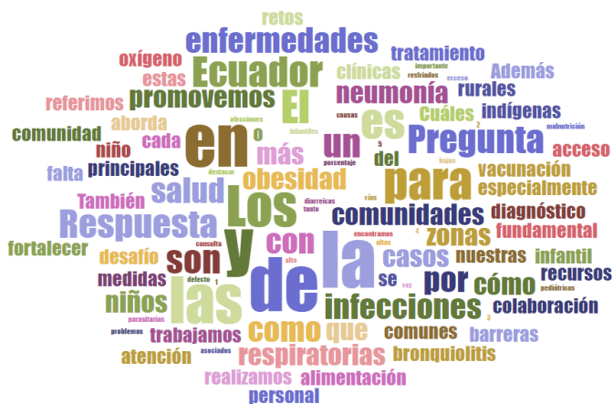
Figura 2.2: Nube semántica de la entrevista al Médico General Integral (MGI) en ONG

políticas nacionales son buenas, pero insuficientes, que por características socioeconómicas, geográficas y hasta políticas no llegan a todos. El análisis temático de las respuestas del médico revela un panorama complejo de la salud infantil y los cuidados de personas vulnerables en Ecuador. Emergen tres categorías principales: enfermedades prevalentes, barreras de acceso a la salud y estrategias de intervención. Las enfermedades respiratorias, diarreicas y parasitarias, así como la malnutrición, tanto por exceso como por defecto, se identifican como los principales problemas de salud infantil. Además, se evidencia la persistencia de enfermedades prevenibles por vacunación, a pesar de los esfuerzos nacionales. Estas categorías permiten comprender el contexto epidemiológico y los desafíos que enfrentan los cuidados de la salud infantil en el país.