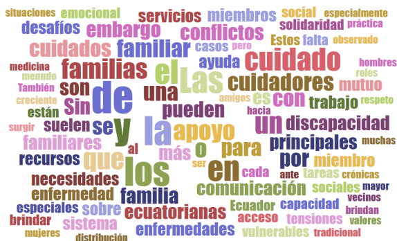
Figura 2.4: Nube semántica de la entrevista a Técnico de Campo en ONG (Proyectos sociales, familia y desarrollo infantil integral de 0 a 3 años)

En la entrevista se evidencia la importancia de las familias en el tema de los cuidados, la funcionalidad de las familias será determinante en la efectividad de los cuidados, solo con la presencia de roles y estatus bien definidos, normas y límites es posible que sea efectivo el cuidado de integrantes con vulnerabilidad. Las familias demuestran una gran resiliencia y solidaridad ante situaciones de enfermedad o discapacidad. Sin embargo, la falta de recursos económicos y la escasez de servicios especializados pueden generar una sobrecarga en los cuidadores principales, especialmente en casos de enfermedades crónicas o discapacidades severas. Esta situación, genera la necesidad de políticas públicas en materia de cuidados a largo plazo y de apoyo a las familias cuidadoras.