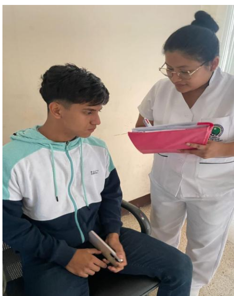
Descripción: Explicación de la investigación