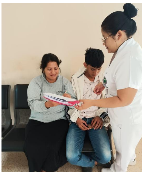
Descripción: Consentimiento informado de un menor de edad