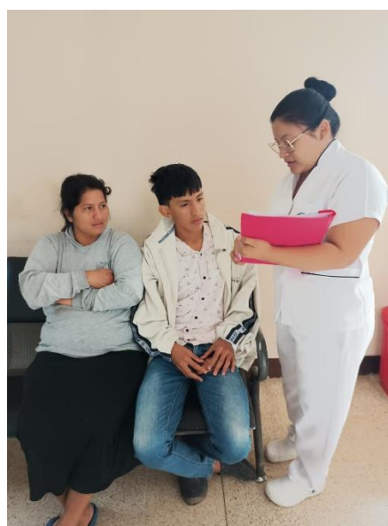
Descripción: Explicación de la investigación