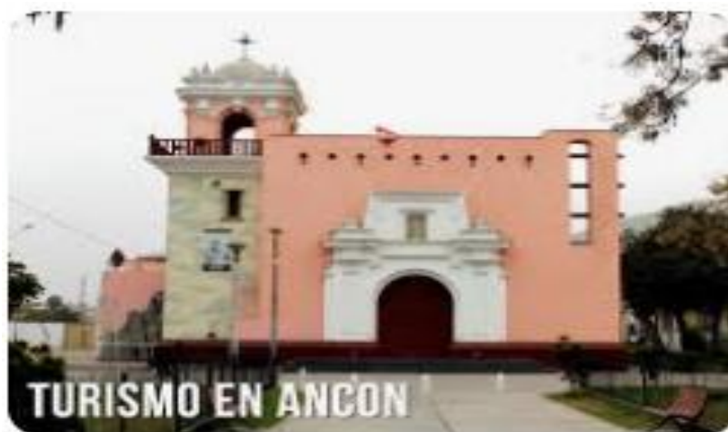
Figura 4 Iglesia San Ancón.

Es primordial que la implementación de rutas se establezca con claridad, considerando todos los aspectos positivos para resaltarlos más, como incluir visitas guiadas a los barrios más históricos, permitiéndole a los turistas disfrutar de un recorrido que les permita aumentar su interés por quedarse más tiempo dentro de la zona.