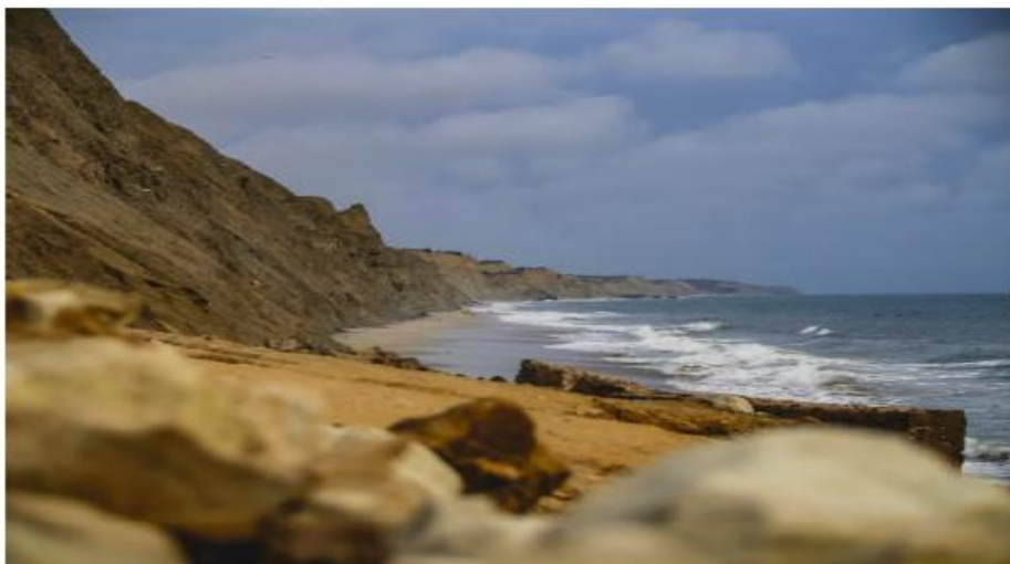
Figura 1 Playa Acapulco - Parroquia San José de Ancón

por los visitantes extranjeros, ni se encuentra posicionado en redes sociales o plataformas de promoción turística, de inclusive atractivos como la playa conocida como “Acapulco” o las rutas patrimoniales carecen de la visibilidad necesaria para atraer un flujo sostenido de visitantes, lo que a la larga plantea la necesidad de cuestionarse si Ancón puede considerarse un destino turístico consolidado o si se encuentra apenas en una fase inicial de turistificación.