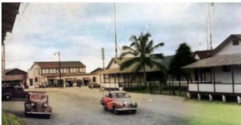
Figura 3 Parroquia San José de Arcón

Analizando la perspectiva actual, la realidad de San José de Ancón es que ya cuenta con una que oscila los 6800 a 6900 habitantes, pero se enfrentan a un gran dilema en cuanto a la satisfacción de sus necesidades básica, demostrando que existen fallas dentro de su entorno que aun requieren de cambios. Entre ellas se destacan la falta de inversión en infraestructura turística, la escasa promoción de su patrimonio cultural, la limitada generación de empleo y el déficit en servicios básicos en algunos sectores periféricos