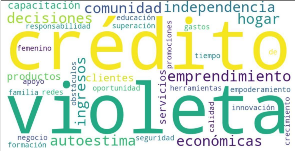
Datos obtenidos de la aplicación de Atlas TI.

En relación al Crédito Violeta, las cinco mujeres entrevistadas destacan criterios prominentes en cuanto a las preguntas establecidas; en este caso, resaltan términos como