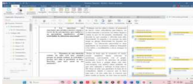
Figura 1 Codificación de entrevista a docente 1

Por último, las percepciones de los docentes y el acompañamiento pedagógico (inclusión, diálogo y uso de señas básicas) es el fortalecimiento para el desarrollo psicosocial en edades de 4 a 5 años, puesto que dan iniciativa a la participación activa, reconocerse a sí mismo y tener una convivencia sin discriminación. Por consiguiente, las prácticas emocionales no solo buscan equilibrar emociones, sino también promueven habilidades sociales que se presentan en el aula y en la vida cotidiana del niño.