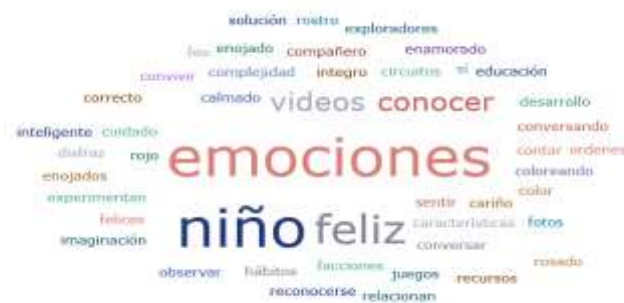
Figura 4 Nube de palabras: Entrevista a docente 1