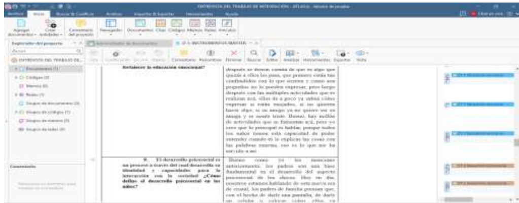
Nota: Datos extraídos de Atlas. Ti 25

En la entrevista se establecieron dos códigos: Educación emocional y desarrollo psicosocial, mismos que nos ayudan a clasificar y obtener palabras claves dentro de la investigación.