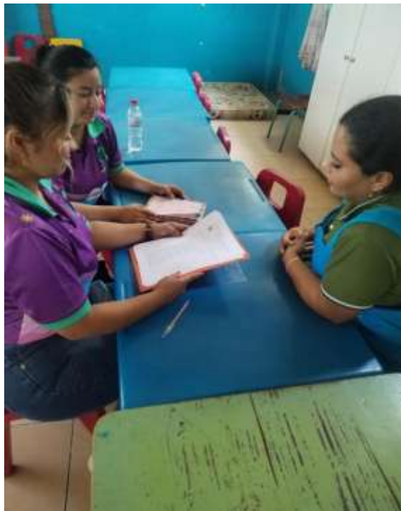
Nota. Fotografía tomada por Gonzabay & Guaranda (2025)