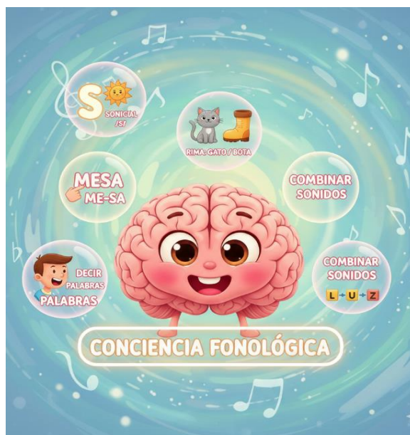
Ilustración 1. Conciencia fonológica

Nota. Ideas clave sobre la conciencia fonológica.