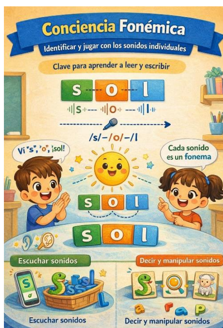
Ilustración 4. Conciencia fonémica

Nota. Ejemplificación de la conciencia fonémica. Generado por Gemini