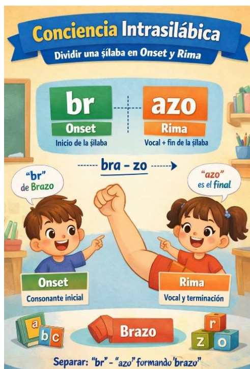
Ilustración 3. Conciencia intrasilábica

Nota. Ejemplificación de la conciencia intrasilábica. Generado por Gemini