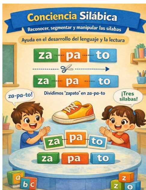
Ilustración 2. Conciencia Silábica

Nota. Ejemplificación de la conciencia silábica. Generado por Gemini