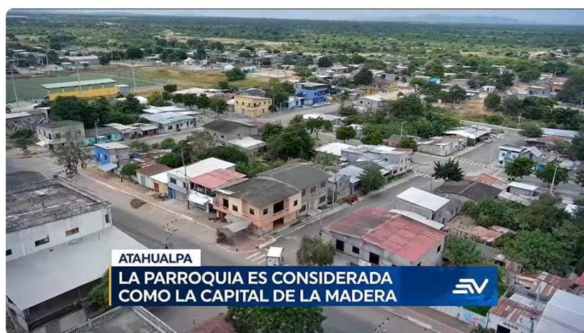
Atahualpa, Santa Elena: la parroquia es considerada como la capital de la madera | Televistazo