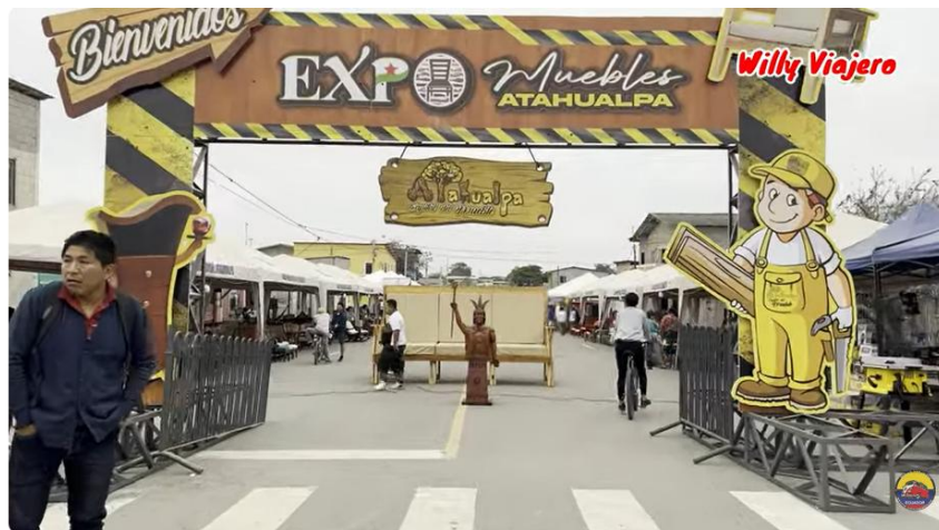
ATAHUALPA FERIA DEL MUEBLE Y ARTESANIA