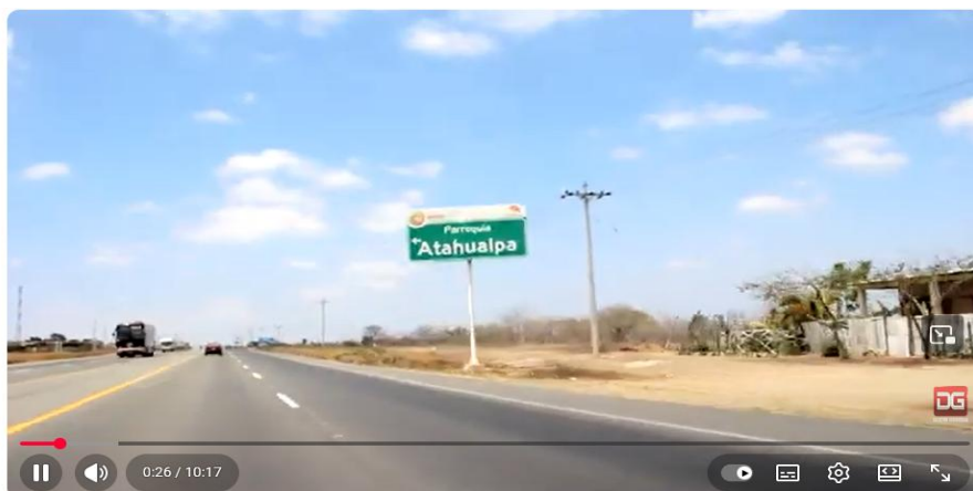
ATAHUALPA MUEBLES PARA TODA LA VIDA