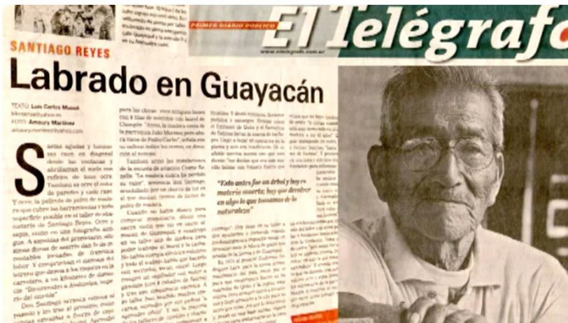
Atahualpa Capital del Mueble