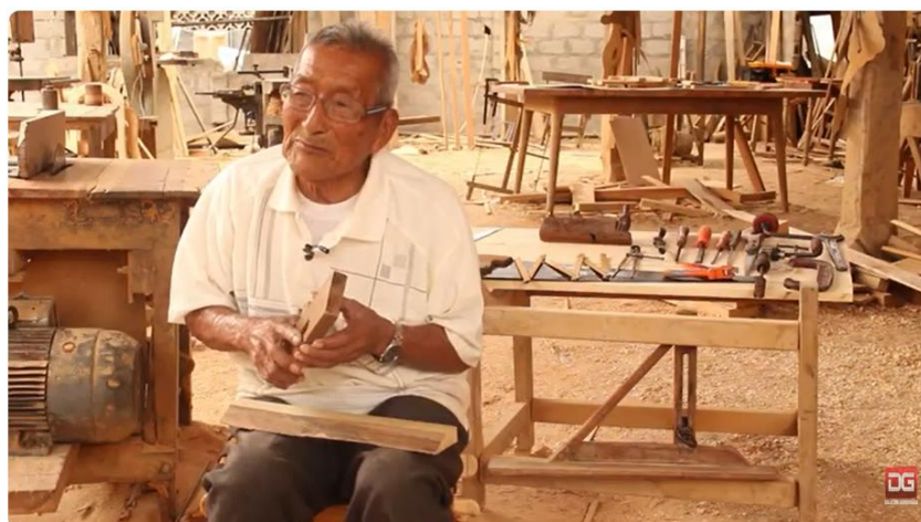
ATAHUALPA MUEBLES PARA TODA LA VIDA