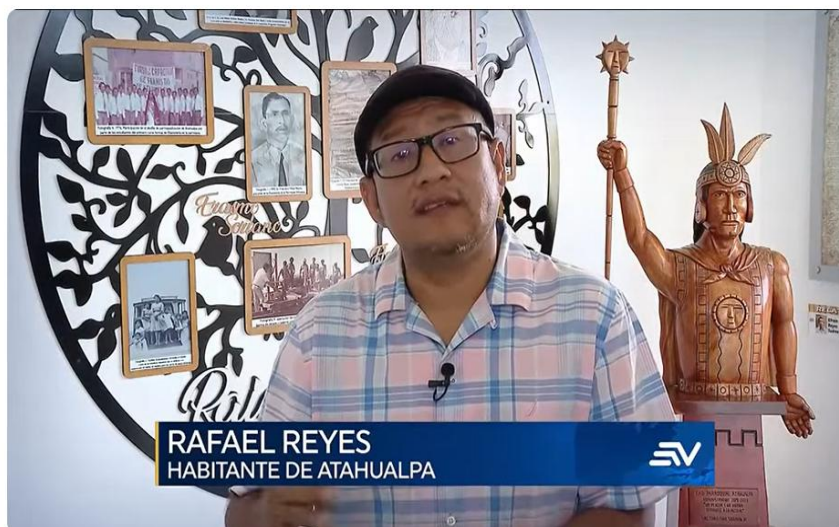
Atahualpa, Santa Elena: la parroquia es considerada como la capital de la madera | Televistazo