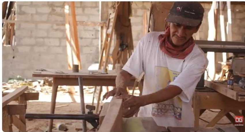
ATAHUALPA MUEBLES PARA TODA LA VIDA