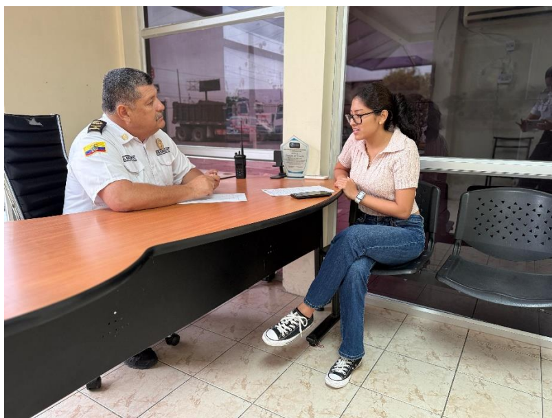
Ilustración 6: Coronel José Bustamante, exjefe provincial de tránsito de la Comisión de Tránsito de Ecuador