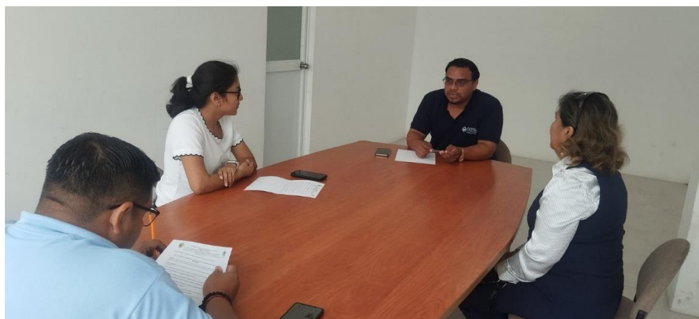
Ilustración 2: Abg. Félix Herrera - Secretario ejecutivo del Consejo de Protección de Derechos del Cantón La Libertad