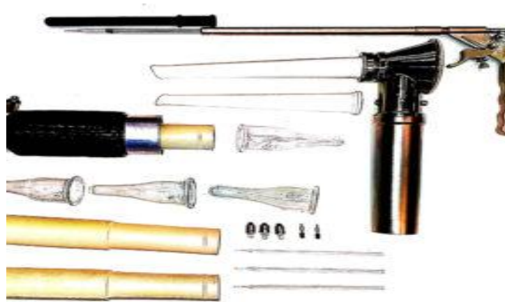
Figura 3: Modelo de vagina artificial. Vera (2017)

14 ml adosado a la vagina artificial, donde las muestras se mantienen en baño maría a 37 °C en la Figura 3 hay un modelo de cómo es la vagina artificial.