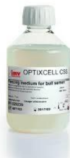
Figura 4: Diluyente Optixcell. Melo (2020)

Producto recomendado para semen fresco y congelado el cual ayuda a la motilidad en concentración subóptimas, este diluyente está basado en liposomas sintetizados (sin proteínas animal) el cual reemplaza la yema de huevo, la composición del producto está basada en carbohidratos, sales minerales, tampón, antioxidantes, glicerol, fosfolípidos, agua ultra pura, antibióticos como: gentamicina, tilosina, lincomicina y espectinomicina, en la Figura 4 se puede apreciar el diluyente Optixcell (Melo, 2020).