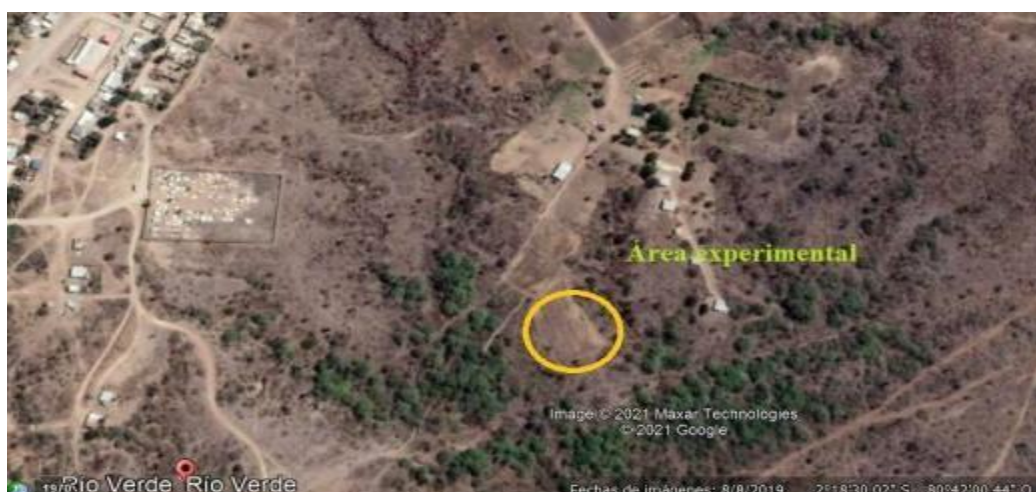
Figura 1 Ubicación del área de instalación del ensayo en el recinto de Río Verde Google Maps (2024).

El clima de esta zona tiene dos estaciones: un invierno lluvioso con una precipitación anual de 7,97 mm y un verano seco con un punto de rocío del 80%, temperatura entre 20 °C y 27,3 °C, una altitud promedio de 70 msnm, los suelos son arcillosos y bien drenados, lo que facilita la retención de humedad y nutrientes