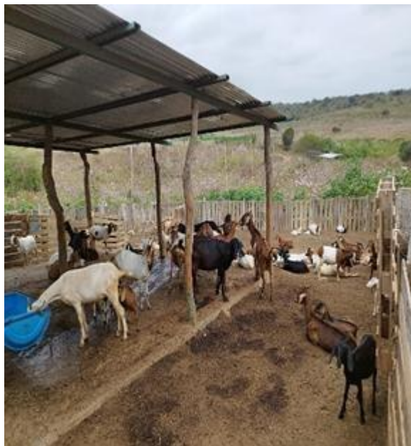
Figura 2A Cabras criollas en Río Verde