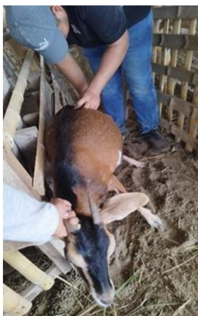
Figura 4A Medición del largo de grupa