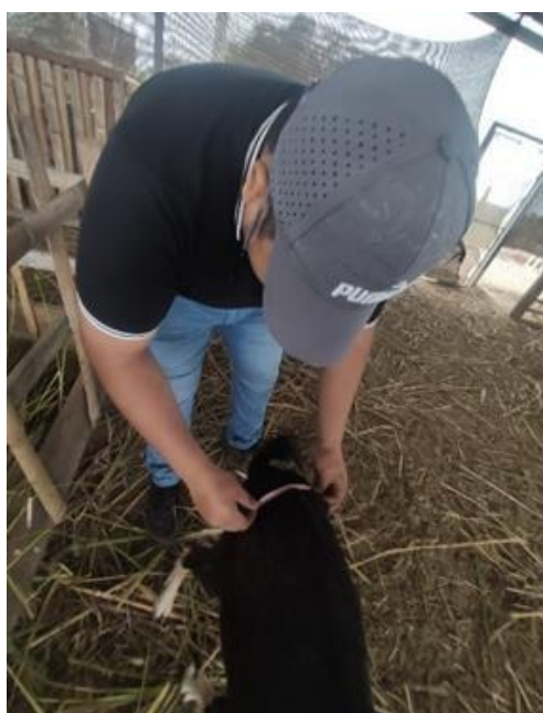
Figura 3A Medición de la grupa anterior