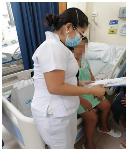
Imagen 1. Explicación sobre el consentimiento informado