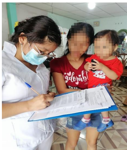
Imagen 2. Aplicación de los instrumentos de recolección de datos