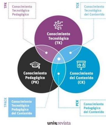
Figura 1. Modelo TPACK ( Technological Pedagogical Content Knowledge ) - Fuente : (UNIR, 2020).

TPACK: siglas en inglés de Technological Pedagogical Content Knowledge Se basa en tres áreas de conocimiento: pedagógico, contenido y tecnológico. Al combinarlas entre sí, se obtienen siete conocimientos específicos.