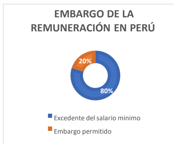
GRÁFICO 2: EMBARGO DE LA REMUNERACIÓN EN PERÚ

Elaborado por: Autor de la investigación