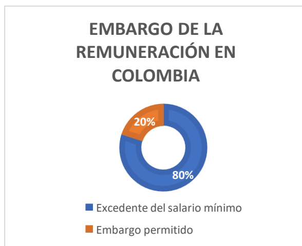
GRÁFICO 1: EMBARGO DE LA REMUNERACIÓN EN COLOMBIA

Elaborado por: Autor de la investigación