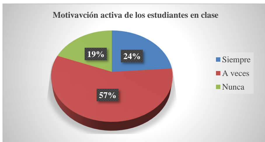
Figura 1: Motivación activa de los estudiantes en clase

Fuente: Estudiantes de 9no E.E.B. “Aurelio Carrera Calvo” Elaborado por: Patricia Cecilia González Muñoz