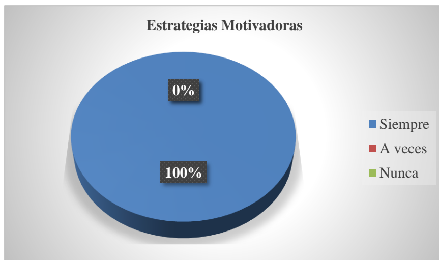
Figura 3: Estrategias Motivadoras