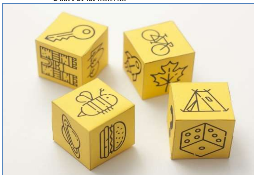
Figura 1. Dados de las historias

Nota: Tomado de Estimulación del lenguaje oral en educación infantil , Sánchez y Sáez, 2020.