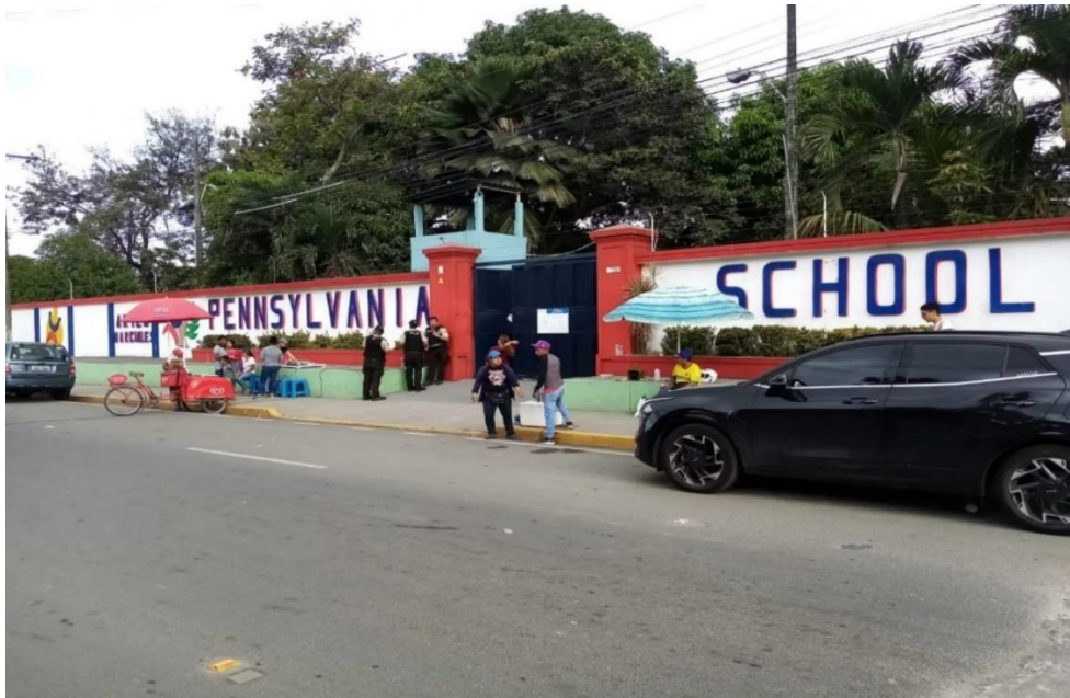
Figura 1 A. Ubicación de la Institución