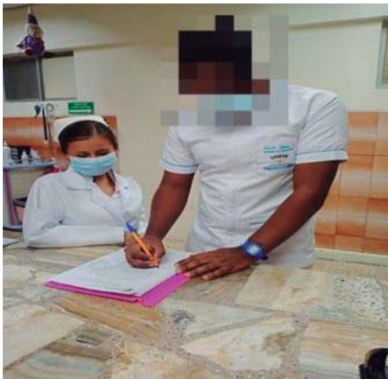
Imagen 3. Recolección de información