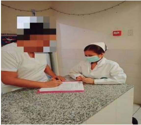
Imagen 1. Socialización del proyecto con los internos de enfermería