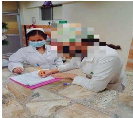
Imagen 2. Explicación sobre el consentimiento informado