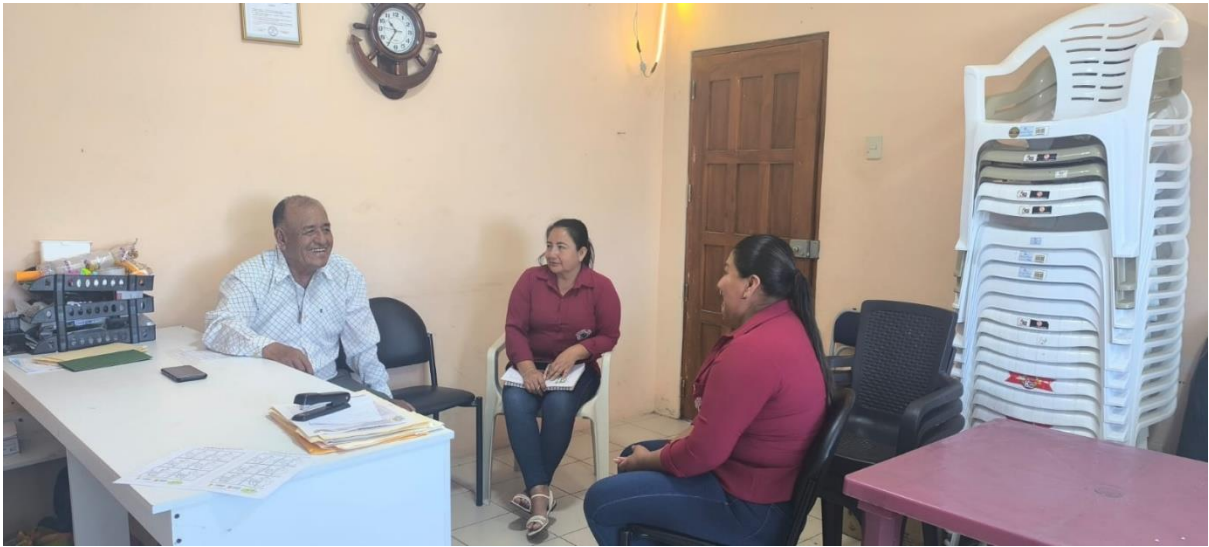
Figura 1. Evidencia del trabajo en territorio