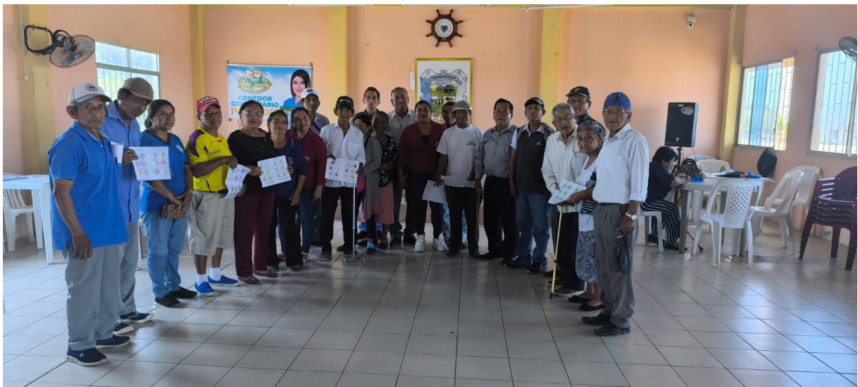
Figura 2. Proceso de levantamiento de información