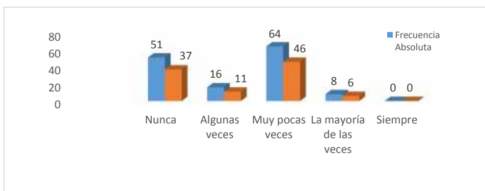
Figura 2.6: Discapacidad visual y nivel de aprendizaje.