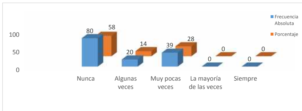
Figura 2.1: Organismos estatales realizan actividades de inclusión

Fuente: Levantamiento de información dirigida a personas discapacitadas visuales, familiares y profesionales.