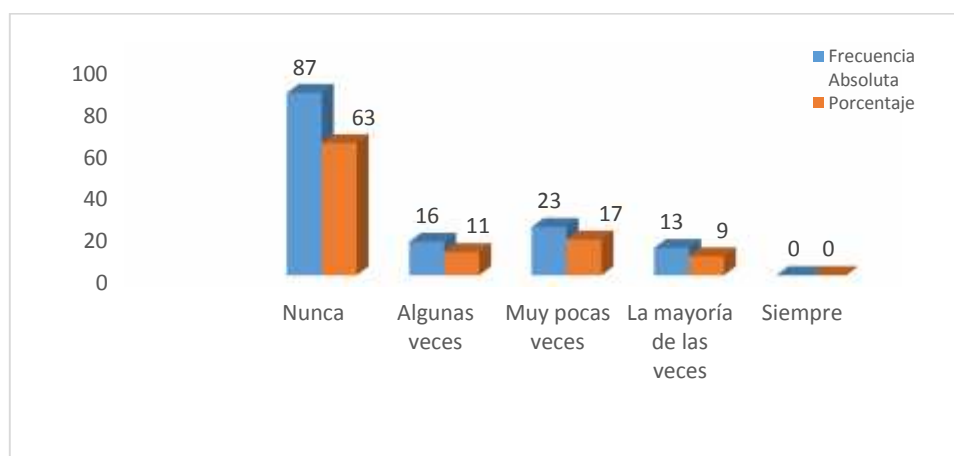
Figura 2.4: Trato igualitario e inclusión social