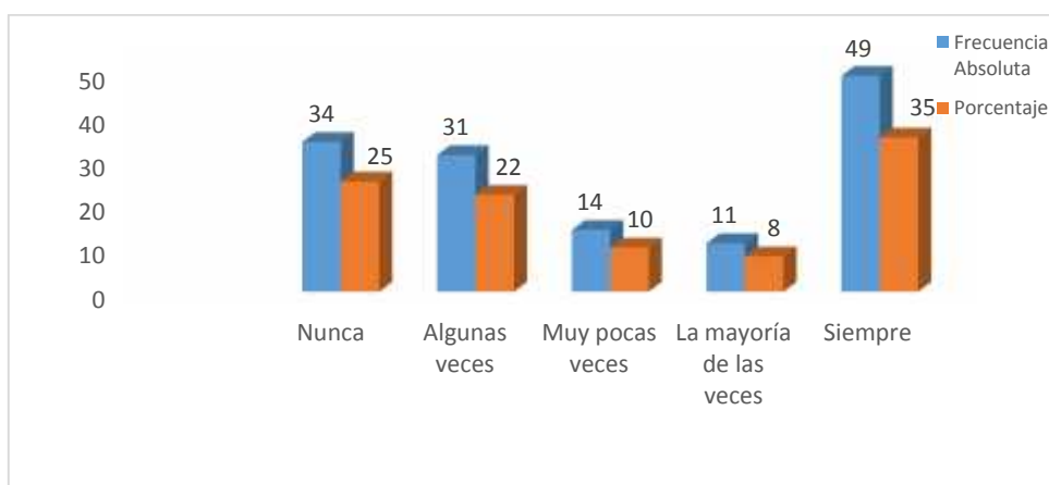
Figura 2.5: Inclusión laboral y oportunidades laborales