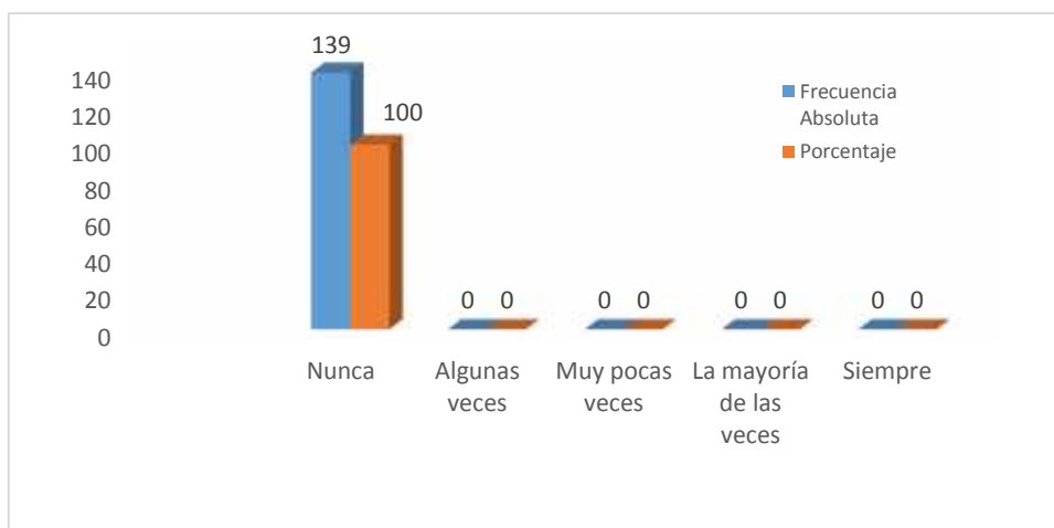
Figura 2.8: Programa alternativo de inclusión socio-económica para jóvenes y adultos con discapacidad visual.