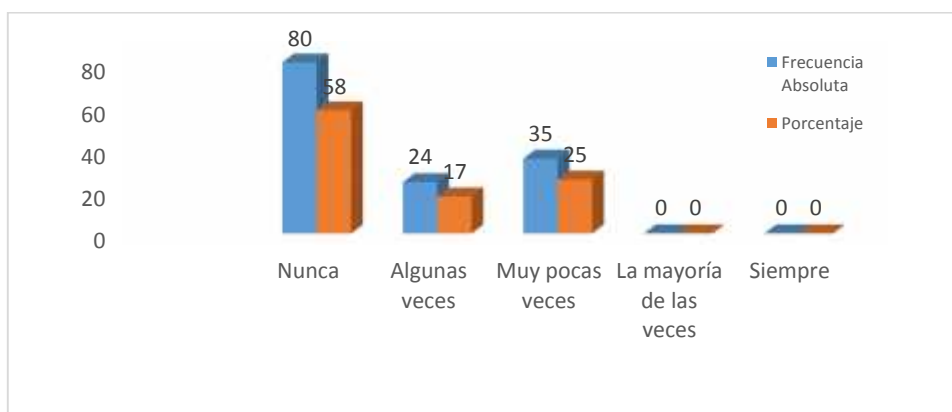
Figura 2.2: Estado actual de las personas con discapacidad