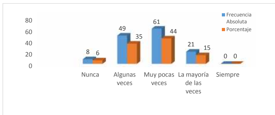
Figura 2.7: Agremiación de los discapacitados visuales