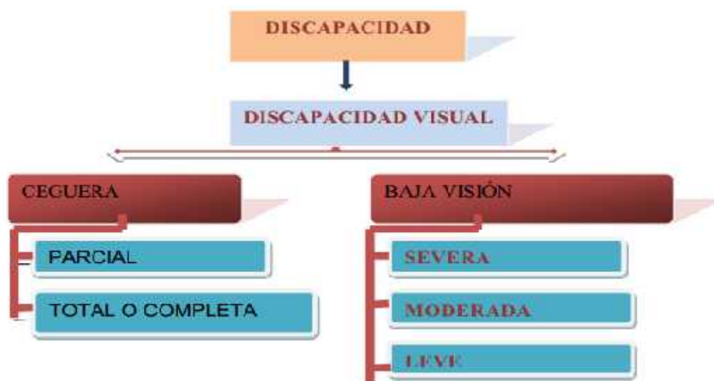
Figura 1.1. Discapacidad