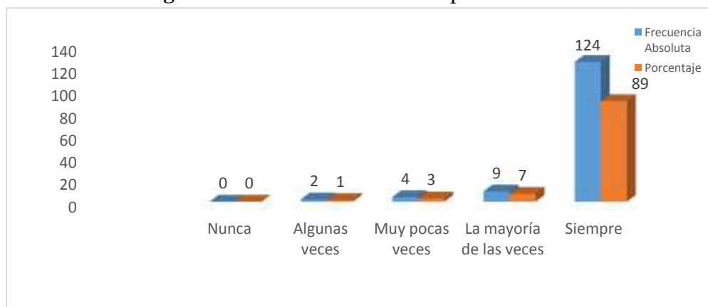
Figura 2.3: Influencia de la discapacidad visual