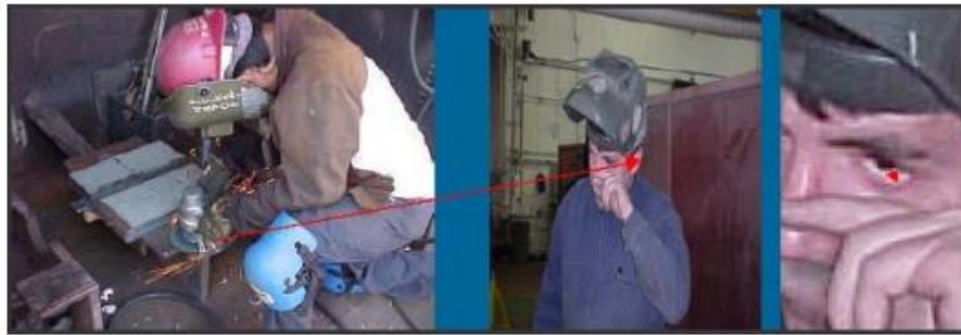
Figura N°16: Lesiones por proyección de partícula.

Elaborado por: Carlos Ríos Pilozo