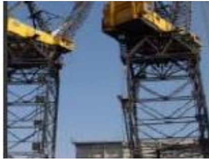
Figura N° 21: Caída de objetos suspendidos.

Fuente: www.conectapyme.com/trabajo_seguridad_soldadura Elaborado por: Carlos Ríos Pilozo