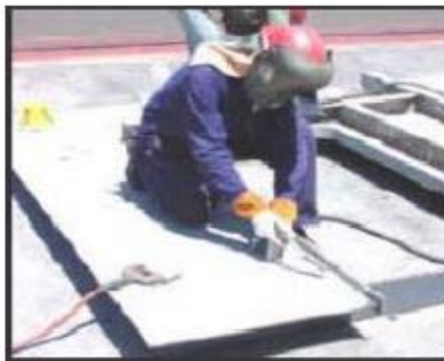
Figura N°12: Riesgo a descargas eléctricas.

Fuente: www.conectapyme.com/trabajo_seguridad_soldadura Elaborado por: Carlos Ríos Piloza