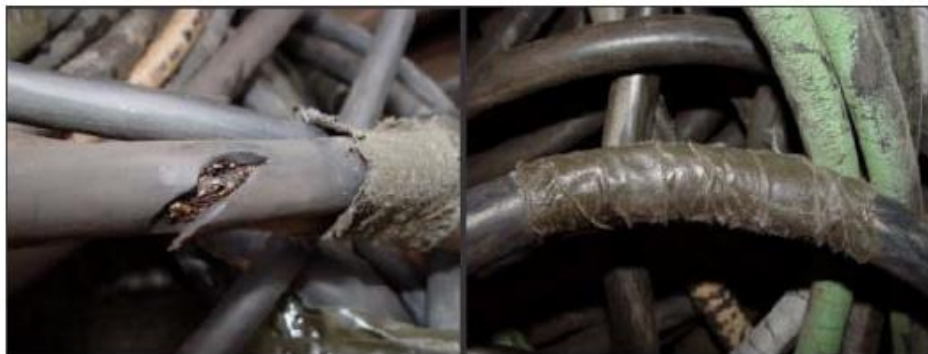
Figura N°13: Riesgo a descargas eléctricas.

Fuente: www.conectapyme.com/trabajo_seguridad_soldadura Elaborado por: Carlos Ríos Piloza