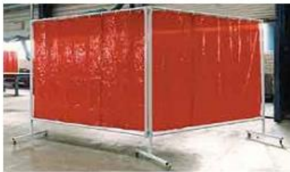
Figura N°11: Mampara aislante de ruido.

Elaborado por: Carlos Ríos Piloza