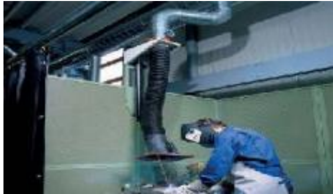
Figura N°20: Protección con ventilación forzada.

Fuente: www.conectapyme.com/trabajo_seguridad_soldadura Elaborado por: Carlos Ríos Pilozo