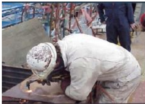
Figura N°17: Lesiones por malas posturas del cuerpo.

Fuente: www.conectapyme.com/trabajo_seguridad_soldadura Elaborado por: Carlos Ríos Piloza