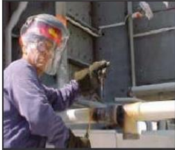
Figura N°14: Máscara de protección facial.

Fuente: www.conectapyme.com/trabajo_seguridad_soldadura Elaborado por: Carlos Ríos Piloza