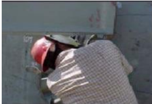
Figura N°18: Lesiones por malas posturas del cuerpo.

Fuente: www.conectapyme.com/trabajo_seguridad_soldadura Elaborado por: Carlos Ríos Pilozo