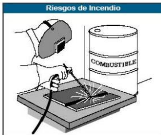
Figura N° 4: Riesgo de incendio.

Elaborado por: Carlos Ríos Piloza