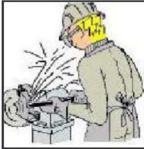
Figura N°8: Riesgo proyección de partículas.

Fuente: www.conectapyme.com/trabajo_seguridad_soldadura Elaborado por: Carlos Ríos Piloza