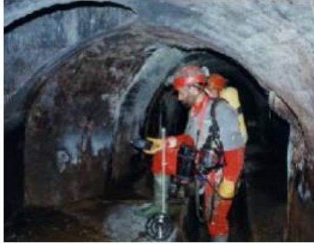
Figura N° 9: Riesgo a espacios cerrados.

Fuente: www.conectapyme.com/trabajo_seguridad_soldadura Elaborado por: Carlos Ríos Piloza