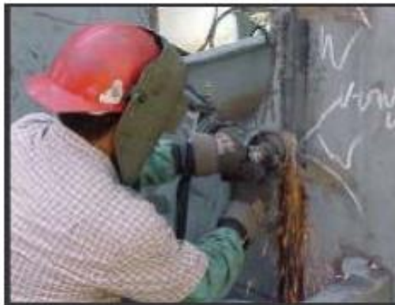
Figura N°10: Riesgo a máquinas de vibración.

Fuente: www.conectapyme.com/trabajo_seguridad_soldadura Elaborado por: Carlos Ríos Pilozo