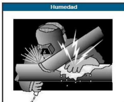
Figura N° 6: Riesgo de humedad, máquinas soldadura de arco.

Fuente: www.conectapyme.com/trabajo_seguridad_soldadura Elaborado por: Carlos Ríos Pilozo