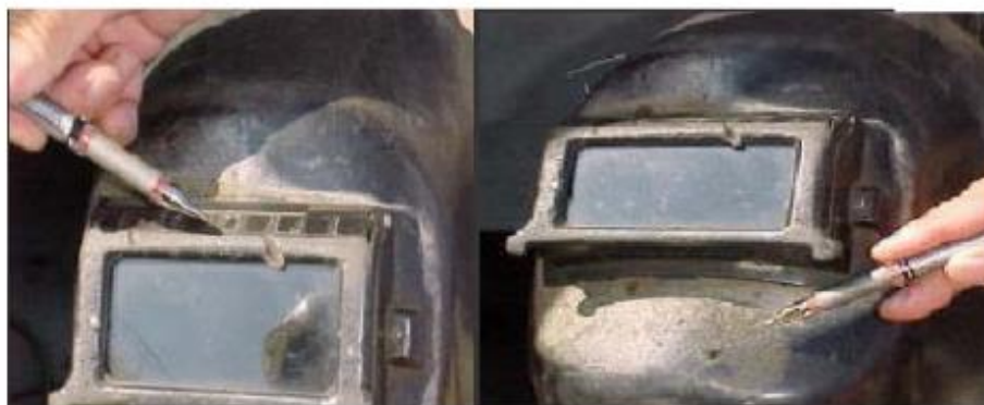
Figura N°15 Máscara para soldar deteriorada

Elaborado por: Carlos Ríos Piloza