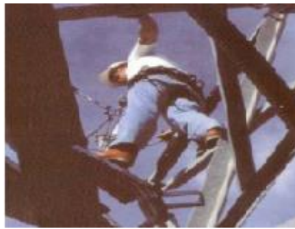
Figura N°19: Trabajos en altura.

Elaborado por: Carlos Ríos Pilozo