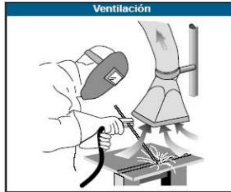
Figura N° 5: Riesgo de ventilación, máquinas soldadura de arco.

Fuente: www.conectapyme.com/trabajo_seguridad_soldadura Elaborado por: Carlos Ríos Pilozo