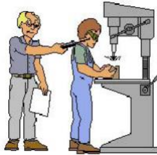
Figura N° 3: Riesgos producidos por el empleo de máquinas herramientas fijas.

Fuente: www.conectapyme.com/trabajo_seguridad_soldadura Elaborado por: Carlos Ríos Piloza