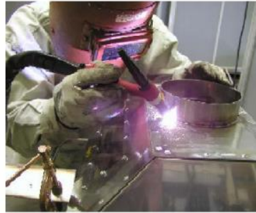
Figura N° 7: Riesgo a radiaciones, máquinas soldadura arco en atmósfera.

Fuente: www.conectapyme.com/trabajo_seguridad_soldadura Elaborado por: Carlos Ríos Piloza