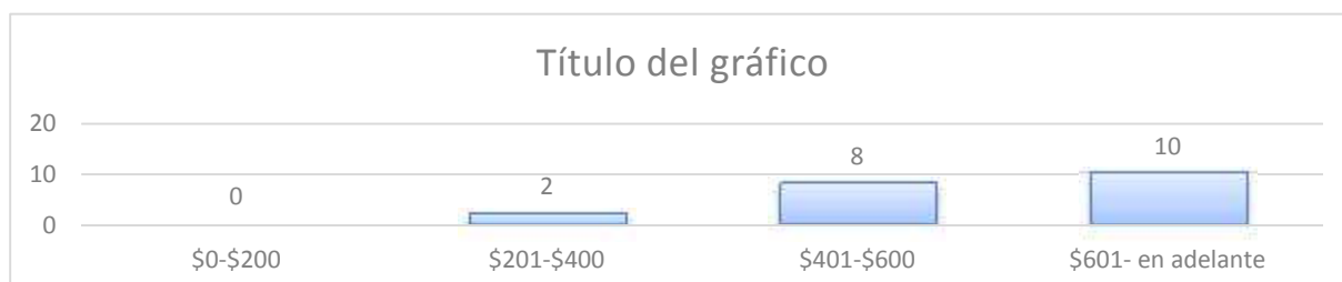
GRAFICO: Ingreso que le permitirá alcanzar el desarrollo económico

Elaborado por: Sabrina Vera y Silvia Laínez