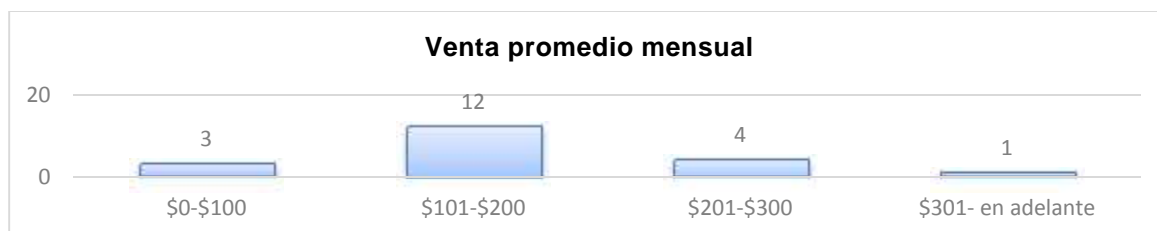
GRÁFICO2: Venta promedio mensual

Elaborado por: Sabrina Vera y Silvia Laínez