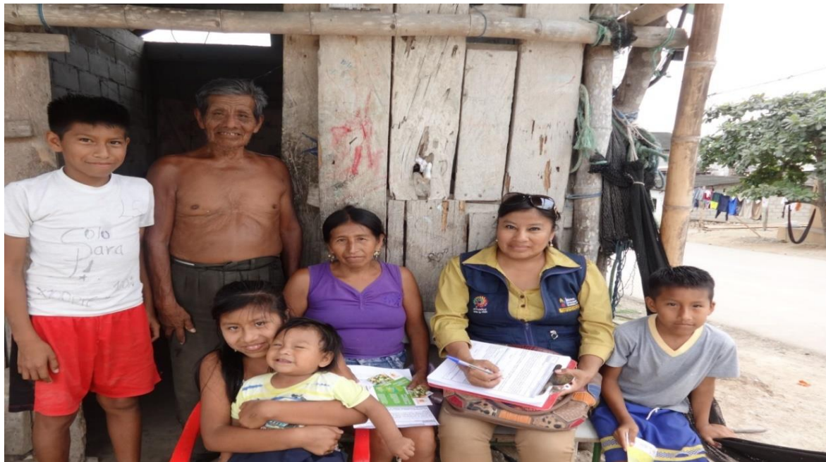
Familia Suárez Orrala beneficiaria del programa Plan Familia