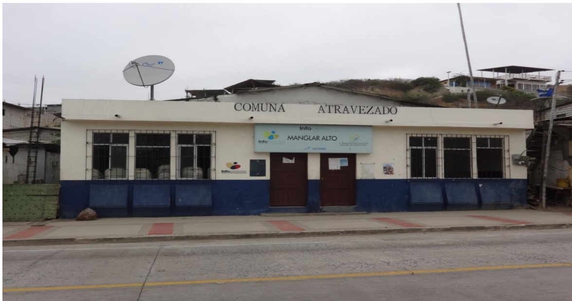
Casa Comunal de Libertador Bolívar