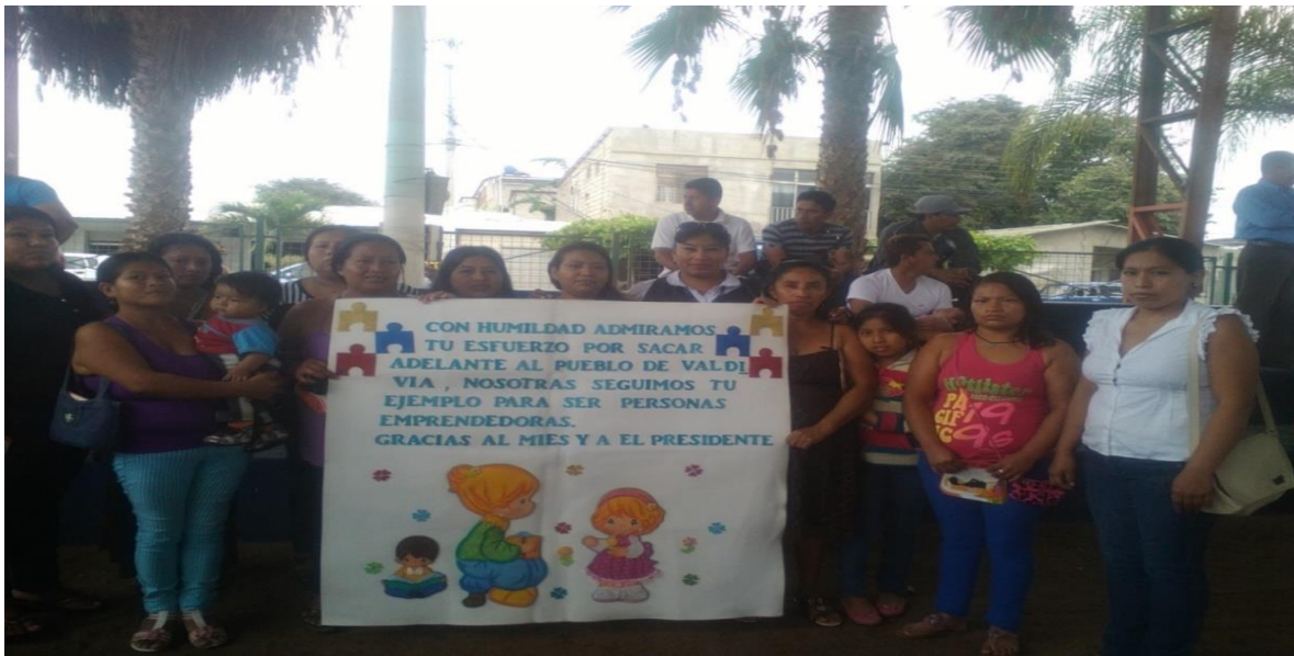
Mujeres emprendedoras con el Crédito de desarrollo humano en Libertador Bolívar