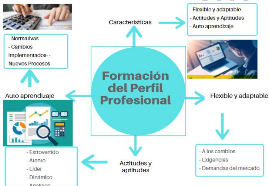
Características del perfil profesional