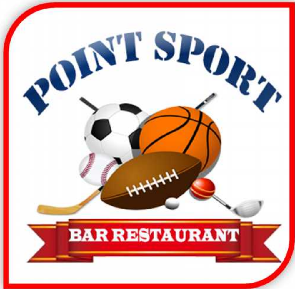
Ilustración 1 Logotipo