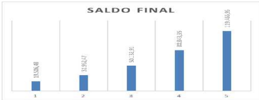
Ilustración 3 Saldo Final

La inversión de POINT SPORT se realizó con capital propio y con préstamo bancario en un tiempo de 3 años. El flujo de efectivo da como resultado una liquidez positiva, que es de gran importancia para la toma de decisiones para futuras inversiones, dejando en evidencia que es un negocio muy rentable, capaz de cumplir con todas las obligaciones adquiridas.