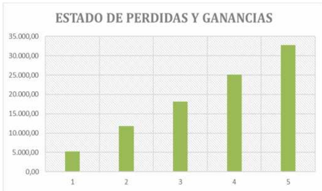
Ilustración 2 Estado de pérdidas y ganancias