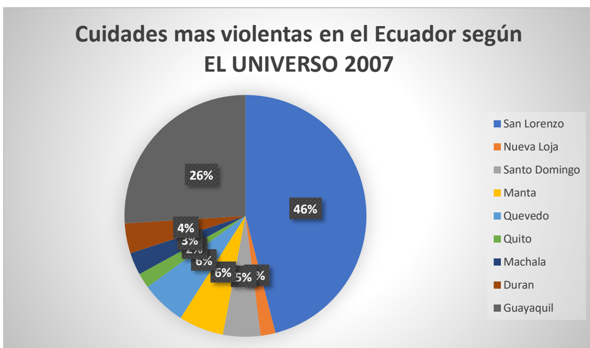
Ilustración 3. ciudades más violentas según EL UNIVERSO

En lo que a Ecuador respecta, el sicariato no es para nada reciente puesto a que este ha existido desde hace mucho tiempo. A mediados del siglo XX, se lo denominaba “muerte por encargo”, y es así que, en la provincia de Manabí, estos actos delictivos ocurrían por líos de tierra, por enemistades, mientras que ahora en la actualidad estos hechos ocurren con el objetivo de ganar territorios en el transporte y comercialización de droga o en algunos casos por venganza (Rodríguez G. , 2008).