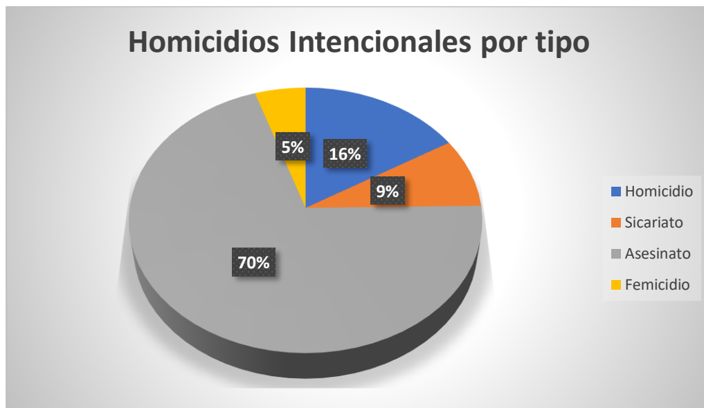
Ilustración 1. Homicidios intencionales por tipo