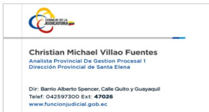
FIGURAS 2: Contestación de Requerimiento Tramite DP24-EXT-2022-00047

"Se realizó las consultas en las bases de datos de los registros administrativos contenidos en el Sistema Automático de Trámites Judiciales (SATJE) a diciembre 2021, según lo requerido, se adjunta el papel de trabajo 0071."