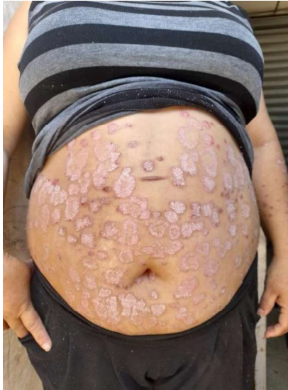
Primer encuentro: psoriasis en el área del abdomen