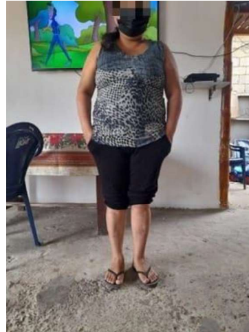
Última semana de intervenciones: lesiones menos rojizas