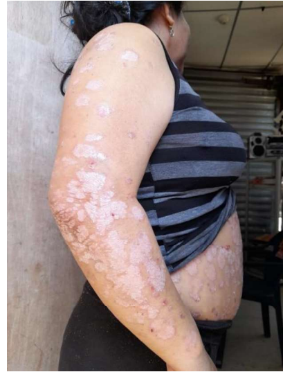
Psoriasis en el área de brazos