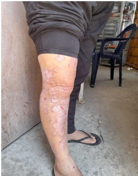
Psoriasis en el área de las piernas