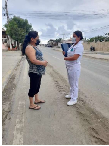
Fomentando la recreación social