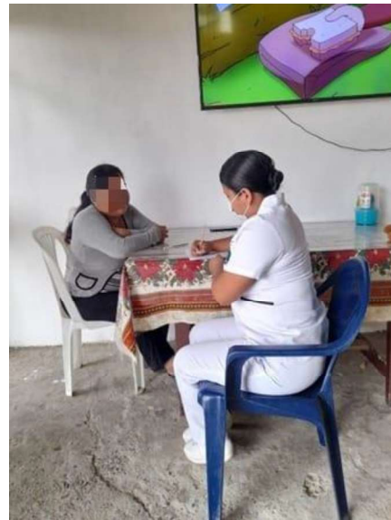
Entrevista: valoración por patrones de respuestas humanas