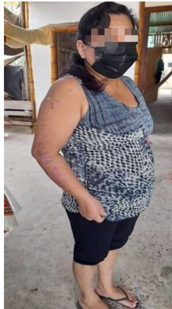
Lesiones menos visibles en brazos y piernas