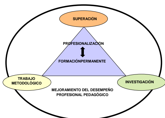
Gráfico Nº 2 Mejoramiento del Desempeño Profesional Pedagógico

concebida la investigación y la actividad científica como forma de trabajo.