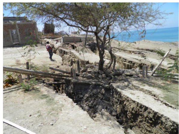
Figura 8. Grietas profundas alcanzan el metro de ancho y cerca de 10 metros de profundidad, producto del desprendimiento del 07.04.2011.

de desplazamientos aún están en movimiento hasta alcanzar los niveles de “asentamiento”, las grietas visiblemente alcanzan los 10 metros de profundidad, sin embargo su tendencia estructural se acerca a la base del acantilado.