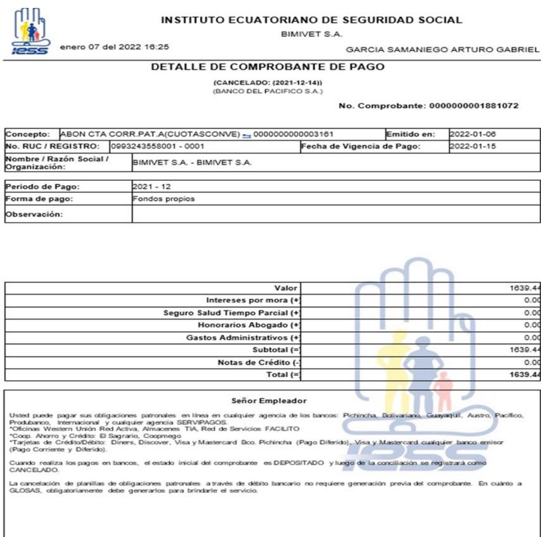
Figura 2 Detalles de un comprobante de pago de Bimivet S.A.